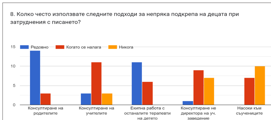
Фигура 2. Разпределение на честотата на използване на различни подходи за непряка подкрепа на децата при затруднения с писането