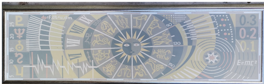
Ил. 1 – Проект за мозаечно пано на тема „Космос“