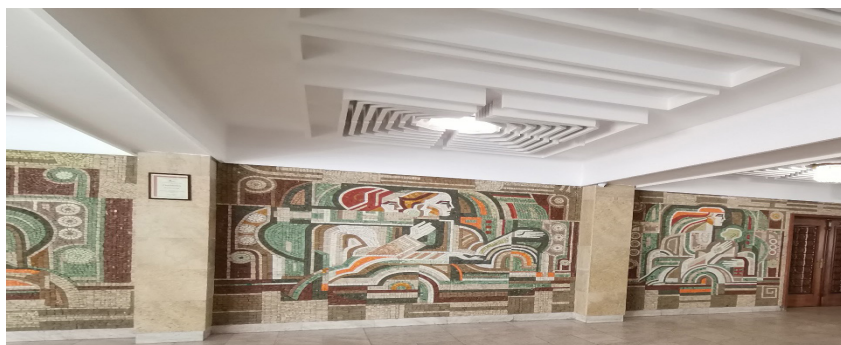
Ил. 4, 5, 6 – мозаечно пано „Родопа древна и млада“, 1986г, Кметството на град Смолян, размери 45кв.м.