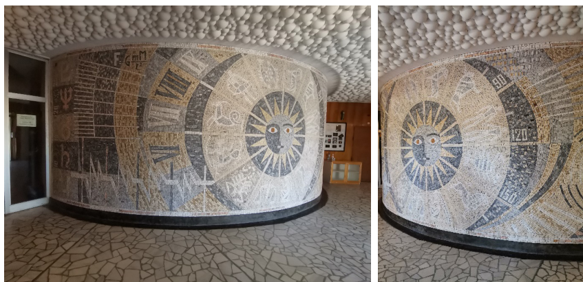
Ил. 2 и 3 – Реализация на мозаечно пано „Космос“, 1980 г., Национална Астрономическа обсерватория, връх „Рожен“, Родопите, размери 30 кв.м,