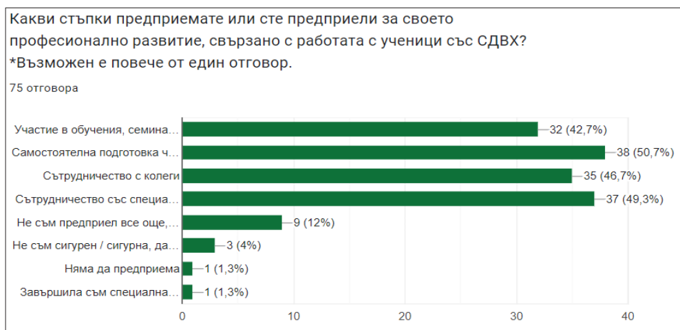
Фигура 11. Готовност за включване във форми за професионално развитие на учителите, за работа с ученици със СДВХ

Последният раздел с въпроси разглежда нагласите на учителите за професионално развитие и обучения за работа с ученици със Синдром на дефицит на внимание и хиперактивност. Сред въпросите е: „Какви стъпки предприемате или сте предприели за своето професионално развитие, свързано с работата с ученици със СДВХ?“. В него анкетираните учители имат право да изберат повече от един възможен отговор, като от резултатите става ясно, че 50,7% се отнасят към опцията „самостоятелна подготовка чрез четене на научна литература и изследвания“; 49,3% към „сътрудничество със специалисти“; 46,7% към опцията „сътрудничество с колеги“; 42,7% към „участия в обучения, семинари и курсове“. Тези показатели дават основание да се изведе тезата, че учителите държат на своето самоусъвършенстване, избирайки различни форми на развитие в работа с ученици със СДВХ. Един от респондентите е завършил „Специална педагогика“ и работи като ресурсен учител, а 4% „не са сигурни“ все още какви стъпки биха предприели за професионалното си развитие. 12% все още „не са предприели“, но се замислят, да го направят, а само 1,3% „не желаят да предприемат“ (фигура 11.).