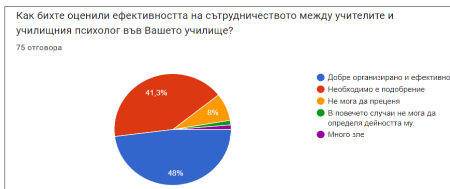
Фигура 6. Оценка на ефективността на сътрудничество

В отговорите на въпросите за поставяне на оценка за ефективността на сътрудничеството с психолозите, се изтъкват и основните ползи от поддържането на добро взаимодействие. Самата „ефективност на сътрудничеството“ е оценена в двете крайности – 41,3% от учителите смятат, че е добре организирана, а 41,3%, че е необходимо подобрене. Интерес представлява един отговор на респондент: „В повечето случаи не мога да определя дейността му“ и друг, който е посочил „Много зле“. 8% не могат да преценят и не дават оценка (фигура 6.). От друга страна оценката на ефективността на обмена на информация и обратна връзка между учителите и училищния психолог е добра – 64% от респондентите смятат, че е полезна; 29,3% – ограничена и 6,7% неефективна (фигура 7.). Като основни ползи от сътрудничеството с училищния психолог, с най-голям процент – 64% се нарежда „по-добра подкрепа за учениците“. След нея с 38,7% е „развиване на умения и компетенции“ и с 46,7% „по-ефективна учебна среда“. Интересно мнение е изказано в опцията „друго“ – „Учениците обичат да разговарят с нея, но не виждам ефективност от работата ѝ“.