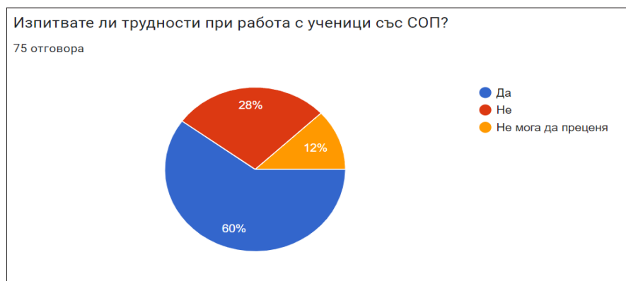
Фигура 5. Регулярност на комуникацията между учителите и училищния психолог

Вторият раздел на анкетата започва с въпроса „В случай на затруднение в работата с ученик със СОП консултирате ли се с училищния психолог за подкрепа, съдействие или подпомагане?“. Неговата цел е да проследи, дали учителите изпитват вътрешна потребност от консултация с училищния психолог в процеса на работа. 89,3% от респондентите са посочили, че се консултират. Различна е регулярността на комуникация на учителите с училищния психолог, като само 1,3% от тях са отговорили, че избягват консултация със специалиста и 1,3%, че не са имали в класовете до момента ученик със СОП. Прави впечатление, че коефициентът на избралите възможния отговор „Рядко, само при сериозни проблеми“, е голям – 30,7% (фигура 5).