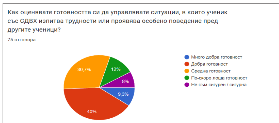
Фигура 10. Оценка на учителите за готовността им за управление на ситуация с ученици със СДВХ

Друг още по-съществен въпрос от анкетата е: „Как оценявате готовността си да управлявате ситуации, в които ученик със СДВХ изпитва трудности или проявява особено поведение пред другите ученици?“. Прави впечатление, че 40% от респондентите изказват положителна „добра“ готовност, 30,7% „средна готовност“, а само 9,3% „отлична готовност“. Следва да се уточни, че 12% от учителите откровено признават, че имат „по-скоро лоша готовност“, а 8% „не са сигурни“ в оценката (фигура 10). Трябва да се има предвид, че анкетираните учители обменят професионалния си опит със своите колеги в различен времеви диапазон, а някои не обменят въобще.