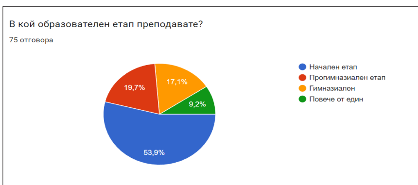
Фигура 2. Образователни етапи, в които преподават анкетираните учители