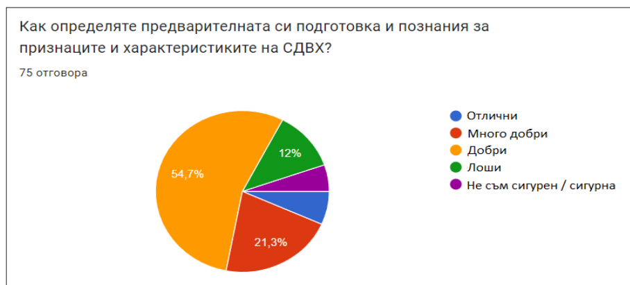
Фигура 9. Самооценка на предварителната подготовка и познания за признаците и характеристиките на СДВХ

определят познанията и подготовката си като „добри“. 12% определят като „лоши“, 5,3% „не са сигурни“ в определянето (фигура 9.). Съществена част от резултатите в раздела е фактът, че само 25,3% от анкетираните учители работят редовно с диагностицирани ученици със СДВХ, а 41,3% понякога.