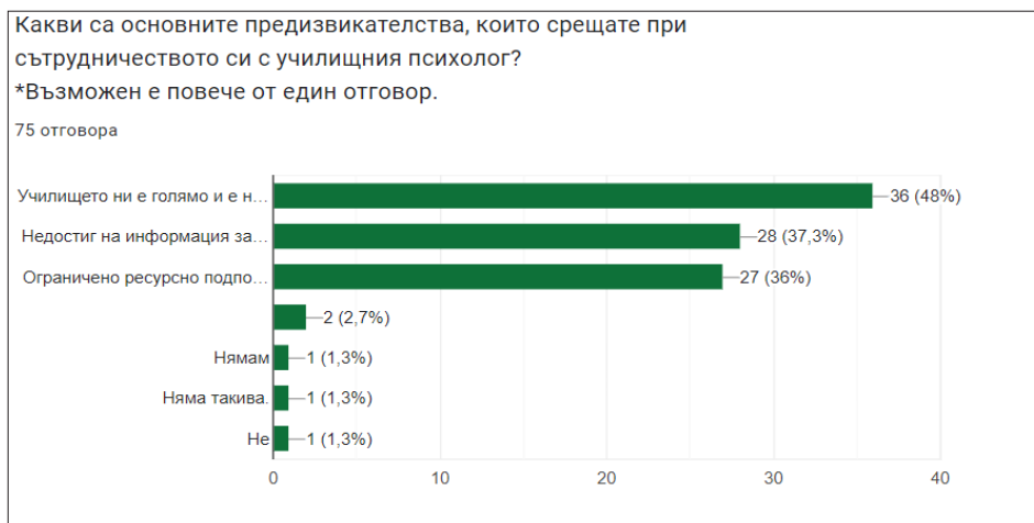
Фигура 8. Предизвикателства в сътрудничеството между учителите и училищния психолог според учителите

Според резултатите в анкетата подобриенето на сътрудничеството между учителите и психолозите за по-ефективна подкрепа на учениците със СОП, би могло да се подобри чрез (низходящо): 1. обучения за стратегии и подпомагане (избрано от 41/75 учители); 2. по-чести срещи с учителите и учениците в присъствието на психолога / психолозите (избрано от 33/75 учители); 3. по-чести срещи на учителите и психолога / психолозите (избрано от 26/75 учители). Опцията „няма необходимост“ е избрана от 6-ма учители (от общо 75). С опцията „друго“ са отговорили 2-ма учители (от общо 75), като са посочили: „индивидуална работа на специалисти с ученици със СОП“ и „психологът да работи по-често с децата със СОП“.