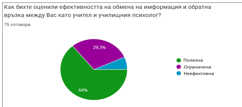
Фигура 7. Оценка на ефективността на обмена на информация и обратната връзка

Основните предизвикателства, които учителите са посочили, се подреждат по следния ред (низходящо): 1. недостиг на психолози (36/75 учители); 2. недостиг на информация за специфичните нужди на учениците (вкл. тези със СОП) (28/75 учители) и 3. ограничено ресурсно подпомагане (27/75). Петима учители са отговорили с опцията „друго“ (5/75 учители) (фигура 8.).