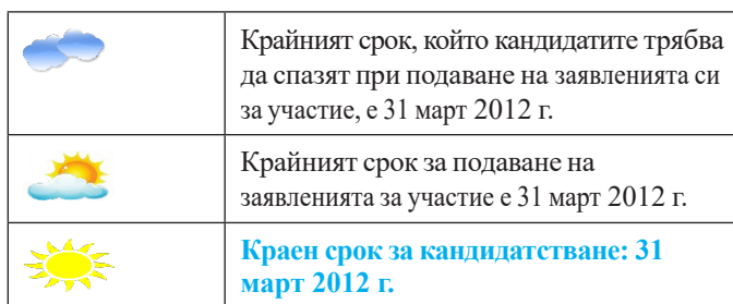
Таблица 2. Съкращаване при приспособяването на речта (Как да пишем..., с. 5)

Посочва се още, че е необходимо (1) да се избягват изрази без връзка с основното съдържание като „както е добре известно“, „общоизвестно е, че“, „по мое лично мнение“, „и т.н.“, „както от гледна точка на А, така и от гледна точка на Б“; (2) дългите конструкции да се разделят на по-кратки изречения, като не се забравят свързващите думи „въпреки това“, „и така“, „обаче“, за да не се губи логиката на текста (Как да пишем..., с. 6). Препоръ-