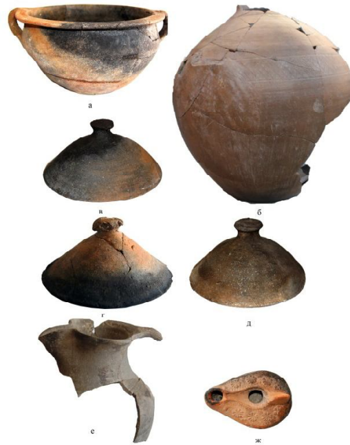
Обр. 5. а – Глинена купа б – Глинен съд от „варварска“ (федератска) керамика в-д – Глинени капаци е – Фрагментирана кана с трилистно устие ж – Глинена лампа