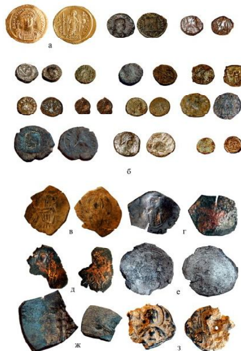
Обр. 6. а – Златен фоллис на Юстиниан Велики (527 – 565) б – Медни монети от пода на казармата – средата и началото на II половина на V в. в-д, ж – Билонови латински имитации – началото на XIII в. е – Сребърен скифат на Алексий I Комнин (1082 – 1118) з – Оловен анонимен печат – втора половина на XI в.