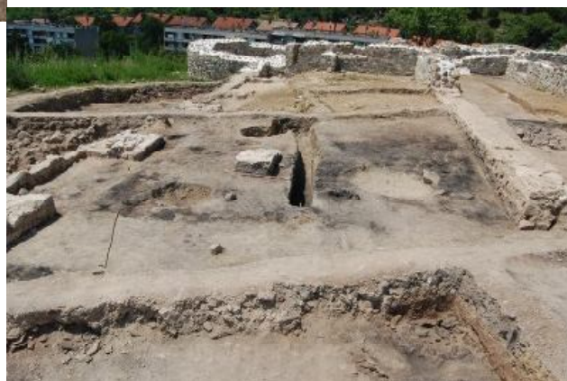
Обр. 2. а – Работен момент от проучванията б – Новопроучената западна част на казармата