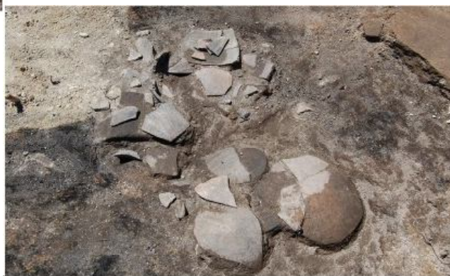
Обр. 3. а – Глинени капаци върху пода на казармата б – Фрагментиран съд от „варварска“ (федератска) керамика