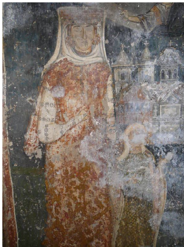
Обр. 4. Ктиторски портрет от църквата “Света Богородица” с. Долна Каменица.