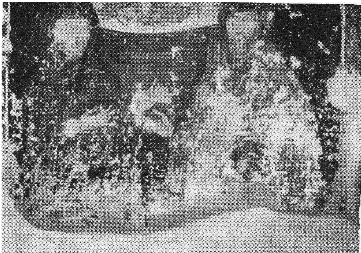
Обр. 5. Ктиторски портрет на монаси от църквата “Света Богородица” при село Долна Каменица.