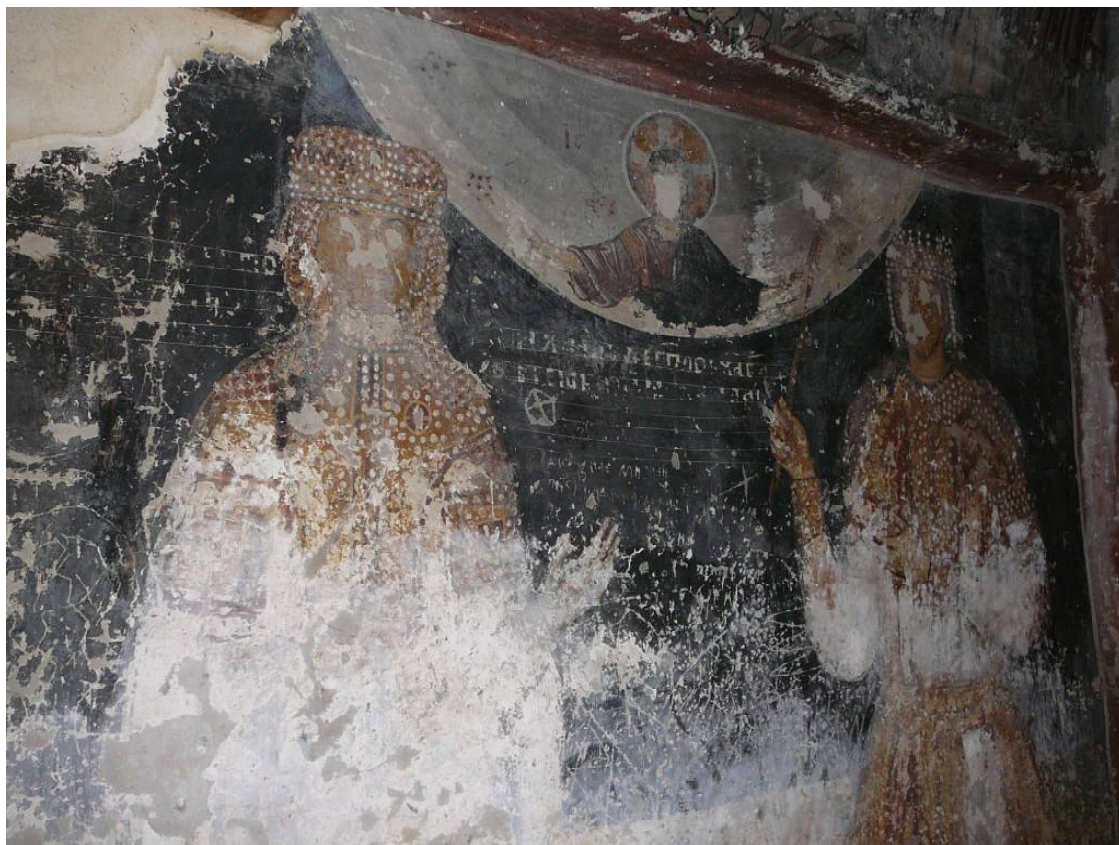
Обр. 1. Църква “Света Богородица” с. Долна Каменница – ктиторски портрет.