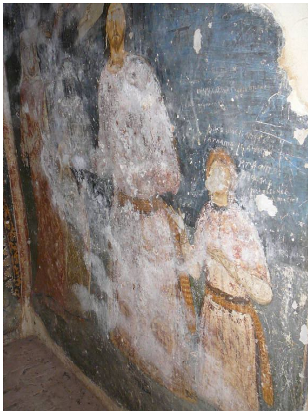
Обр. 3. Църква “Света Богородица” с. Долна Каменица – ктиторски портрет.