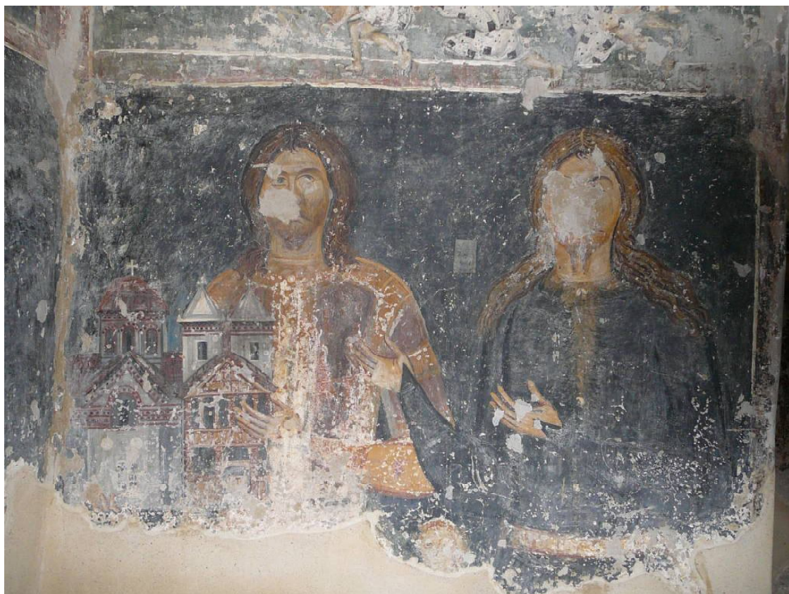
Обр. 2. Църква “Света Богородица” с. Долна Каменница – ктиторски портрет.