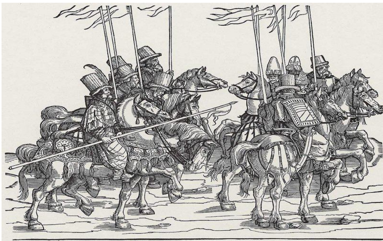
Обр. 3. Стратиоти, съпровождащи император Карл V, на Аугсбургският сейм в 1530 г.