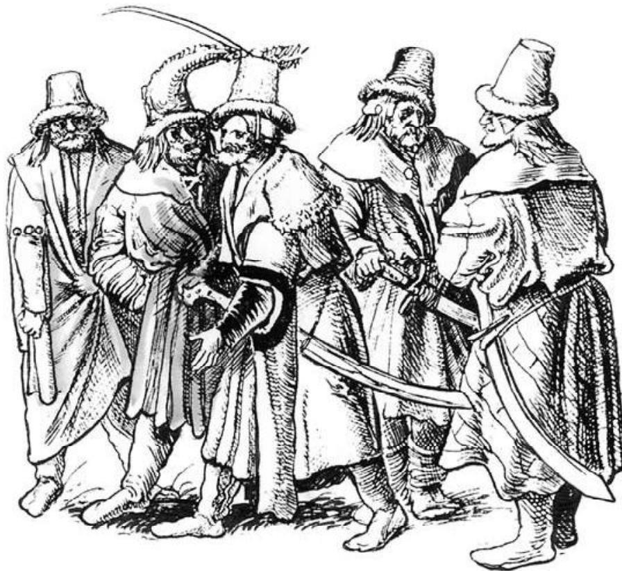
Обр. 1. Стратиоти, изображение на Урс Граф, около 1515 г.