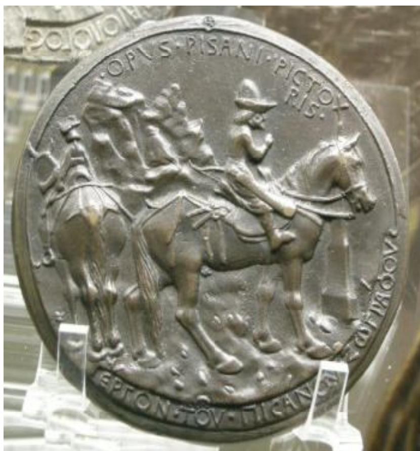
Обр. 4. Реверс на медалион на Пизонело, 1438 г.