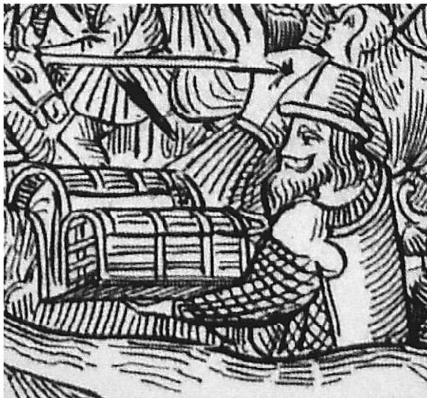
Обр. 2. Изображение на стратиот от сражението при Фурново 1495 г., около 1500 г.