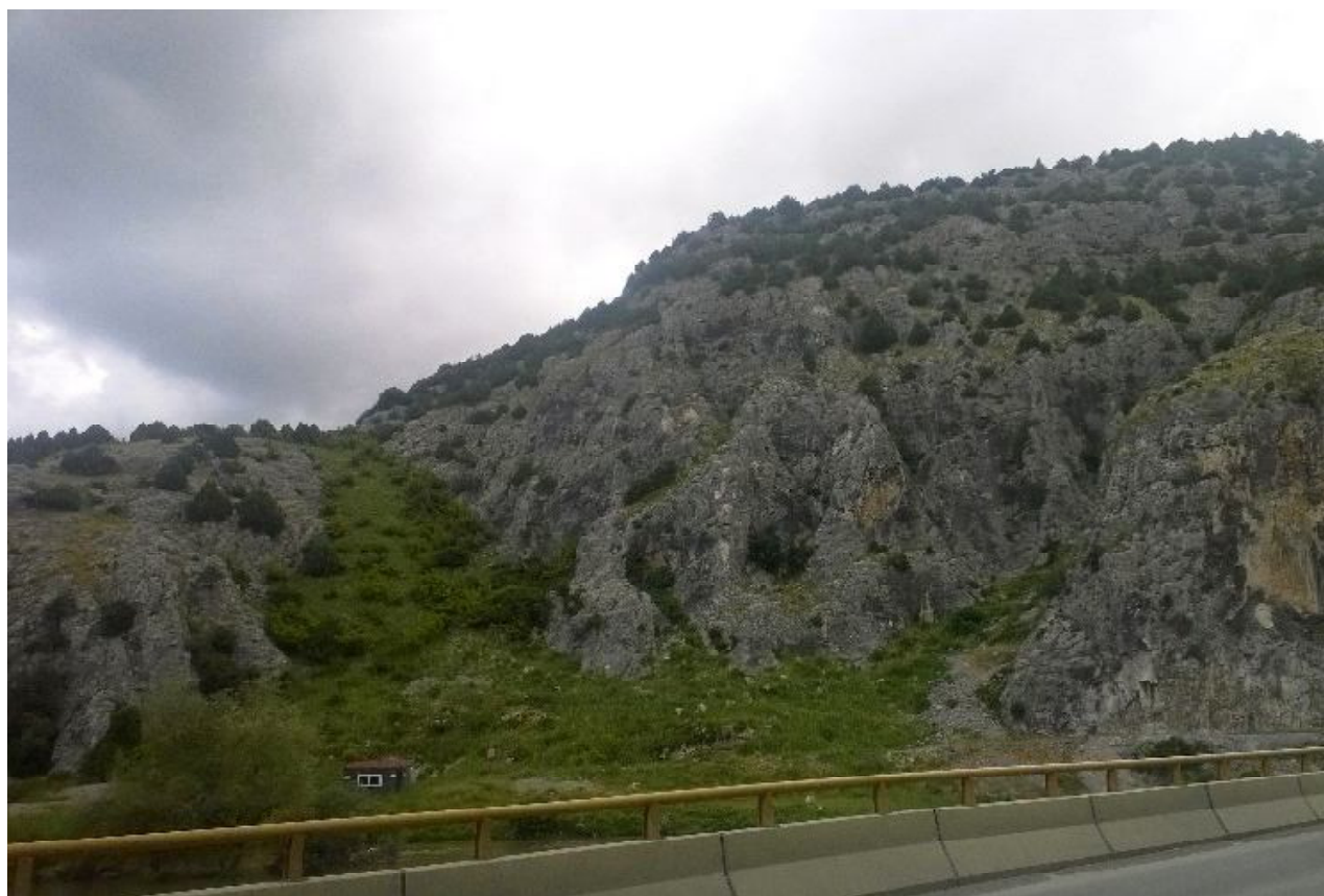
Обр. 5. Западният склон на Просек, изглед от моста на р. Вардар.