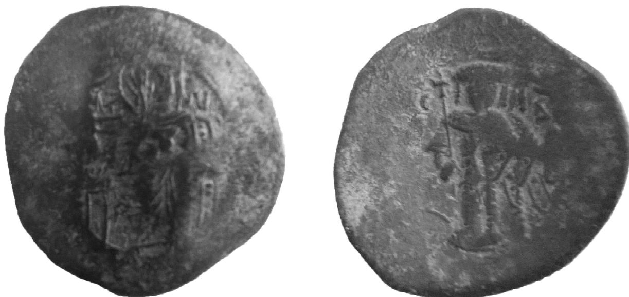
Обр. 3. Билоновата трахея на Исаак II Ангел (1185 – 1195)