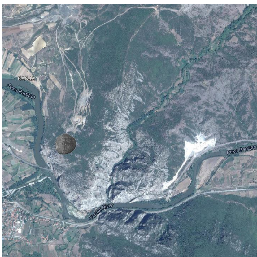
Обр. 2. Сателитна снимка на района на Просек с отбелязано мястото на намиране на монетата (сателитна снимка: https://www.google.bg/maps/ )