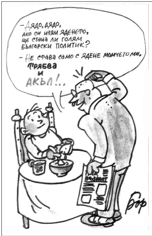
Пародийна карикатура от Петър Борсуков във великотърновския вестник „Борба“, № 103 от 2 юни 2008 г., с. 3, горе вдясно на наборната страница

Заглавен комплекс на с. 4 за хумор и сатира „Царевиц“ в юбилейния брой 33, 20-22 март 1993 г. на регионалния вестник „Борба“ – В. Търново