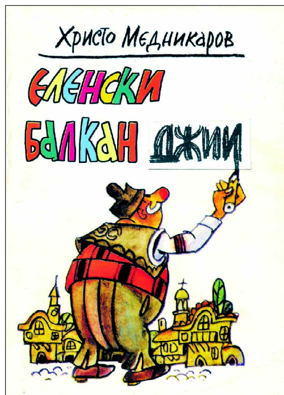
Корица и авантитул с илюстрации-карикатури от Петър Борсуков в книгата „Еленски балканджии-шегаджии“ (2001).

Неотдавна пак срещнах Петър Борсуков, който сякаш на шега, с опитната си ръка, щрихира с думите на карикатурист времето, в което се създаваше хумористичната страница на някогашния великотърновски окръжен вестник: