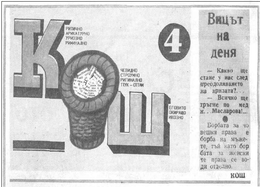
Заглавен комплекс на страница за хумор и сатира и куриози „КОШ“ на регионалния вестник „Борба“, № 15, 8 март 1991 г., с. 4. В долния край на страницата – карикатури