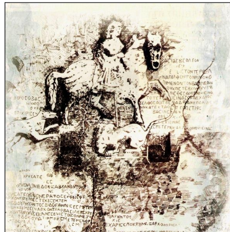
Ил. 4. Барелефът на Магарския конник, извисяващ се край първата българска столица Плиска. (Рисунка)

Според традицията се събуваме и влизаме сами в храма, чиято вътрешност е изцяло от бял мрамор. В центъра на храмовото пространство се намира олтарът с жертвеник, върху който гори вечен огън. След като изпълняваме определени ритуали, внимателно разглеждаме вътрешната подредба на светилището. Точно срещу олтара има друг цветен барелеф на Ахура Мазда, под който се намира голямо цветно изображение на Заратустра, облечен в сияйни бели дрехи и препасан със златотъкан пояс и характерна персийска препаска, а на главата му