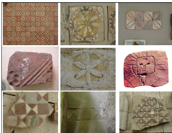
Ил. 13. Битови и ритуални предмети и накити от Плиска, Преслав и Мадара. (Фотографии от фотоархива на екипа)

лъв, прави описанието на тези артефакти първо чрез настоящата публикация (получила финансиране в документацията на проведената експедиция (срв.: Протоколи от Заседанията на Академичния съвет на СВУБИТ от 28.06.2008 г. и 23.10.2008 г.). Без съмнение съпоставяните от нас информационни обекти са съществена следа в картографирането на култовите трансмисии от Мала Азия към Балканския полуостров. Всичко това придава особено значение на експертните оценки на специалистите по проблематиката. В иницирираната от екипа на настоящото изследване академична беседа на 31.10.2008 г. с археолога проф. Станислав Станилов се потвърди връзката на „българския“ лъв със Сасанидски Иран.