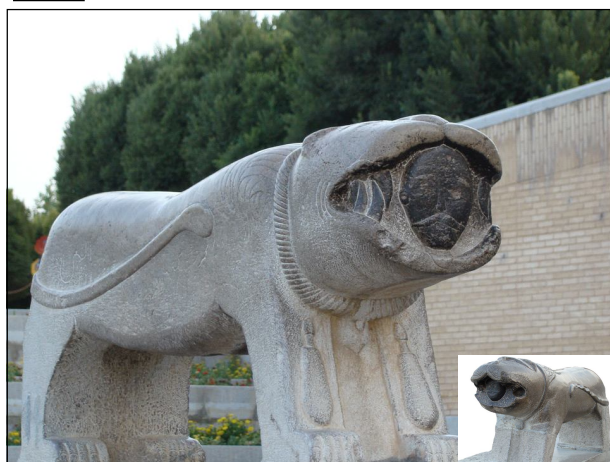
Ил. 7. Уникалните и изключително наситени с послания скулптури от гранит – лъвски фигури, разположени на моста в Исфахан, символизиращи бот Митра („ирански“ лъв).