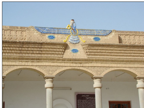
Ил. 5. Барелефът на Ахура Мазда над входа на светилището на зороастрийския Храм на огъня в Язд.