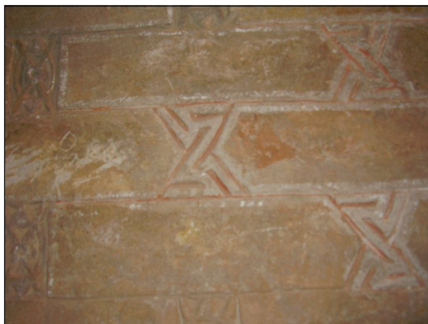
Ил. 9. Митраистичният кръстен знак се намира в основата на най-стария градеж на култовите постройки.