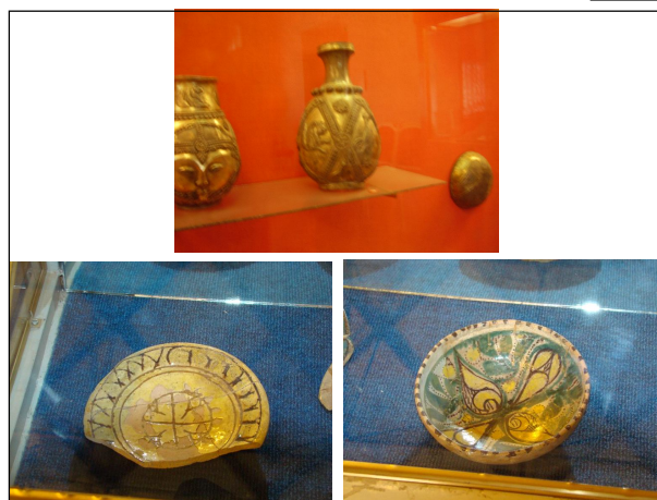
Ил. 10. Митраистичният кръстен знак откриваме и в глинени и керамични съдове от различните епохи.

Отсъствието на следа в историографията по проблематиката за „българският“ лъв, както и за „иранският“