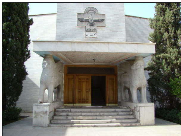
Ил. 6. Храмът на зороастрийците в Исфahan.