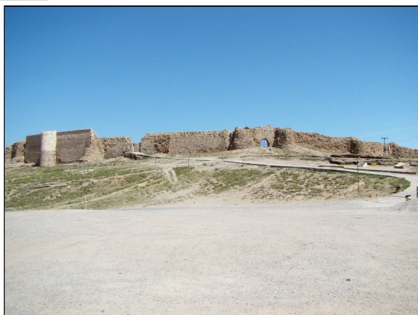
Ил. 1. Зороастрийското светилище Тахт-е-Солейман – Тронът на Соломон (Takht-e-Soleiman) (III–IV в.).