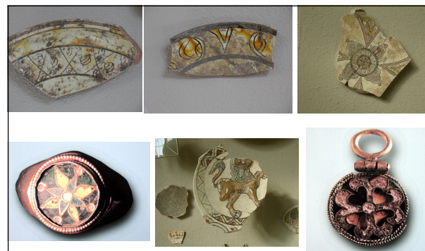
Ил. 12. Подова и стенна керамика и мозайка от Плиска и Преслав.