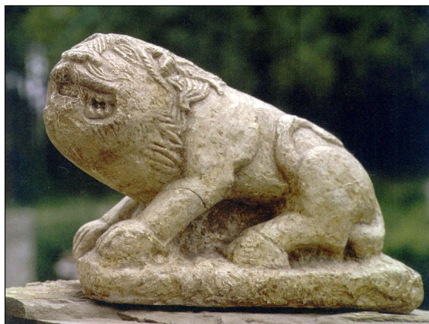
Ил. 8. Мраморната статуетка на лъв, намерена в южната част на България или в Плиска (IX в.), чийто оригинал се съхранява в Софийския археологически музей („български“ лъв).