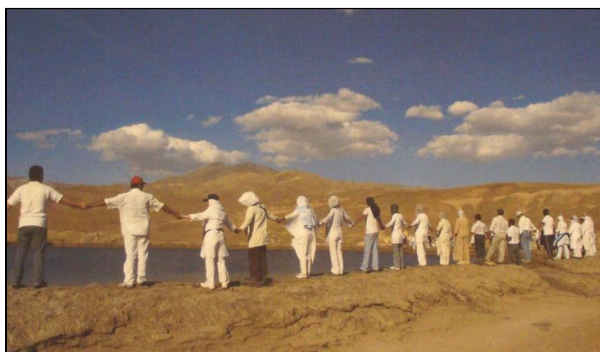
Ил. 2. Ритуал на зороастрийци около священото езеро в комплекса на Тахт-е-Солейман, който изключително точно прилича на августовската паневритмия на Бялото братство в България при Рилските езера.