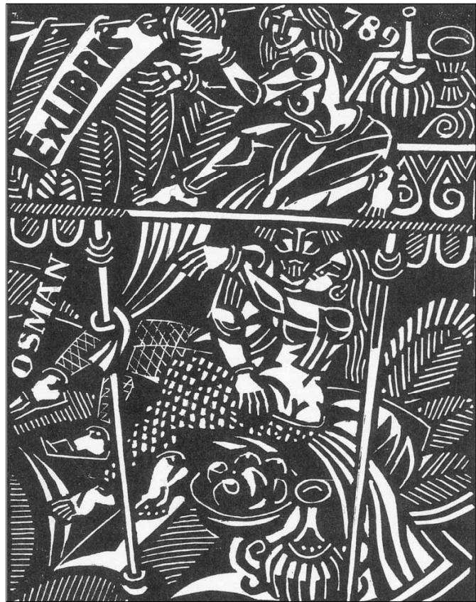
Из цикъла „ORIENT“