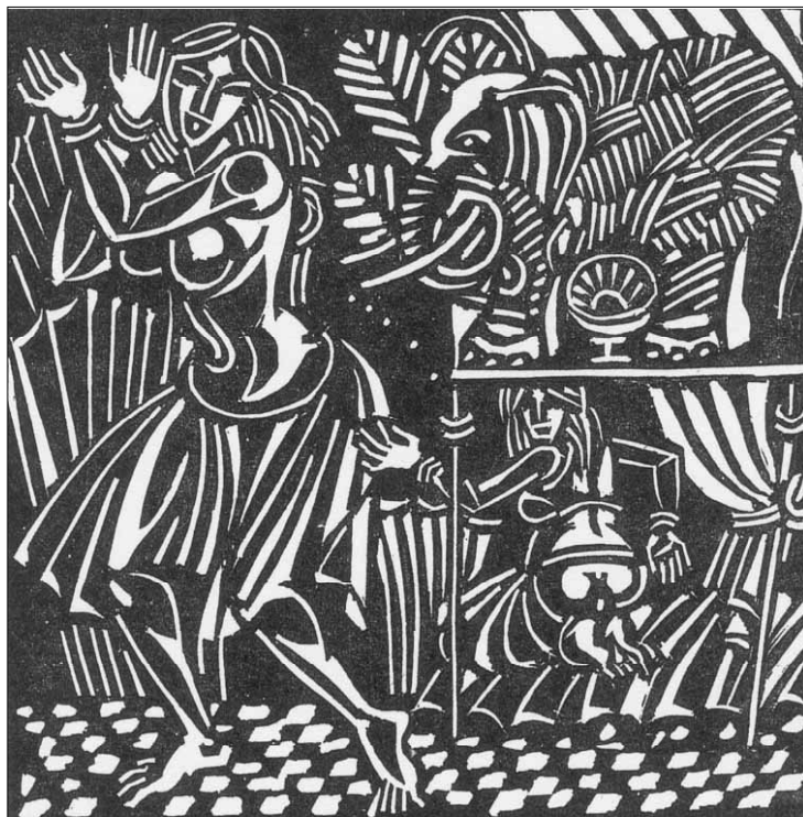
Из цикъла „ORIENT“