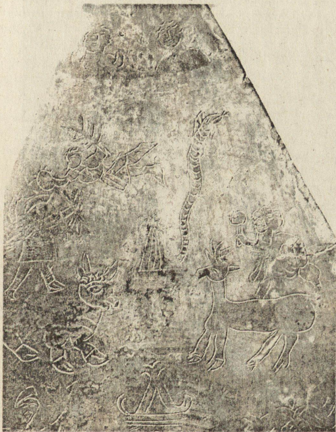
Обр. 2. Горен и централен регистър

Изображенията са предадени в три последователни регистъра, които не са отделени един от друг с релефна гравирана рамка, както най-често се практикува при другите подобни паметници.