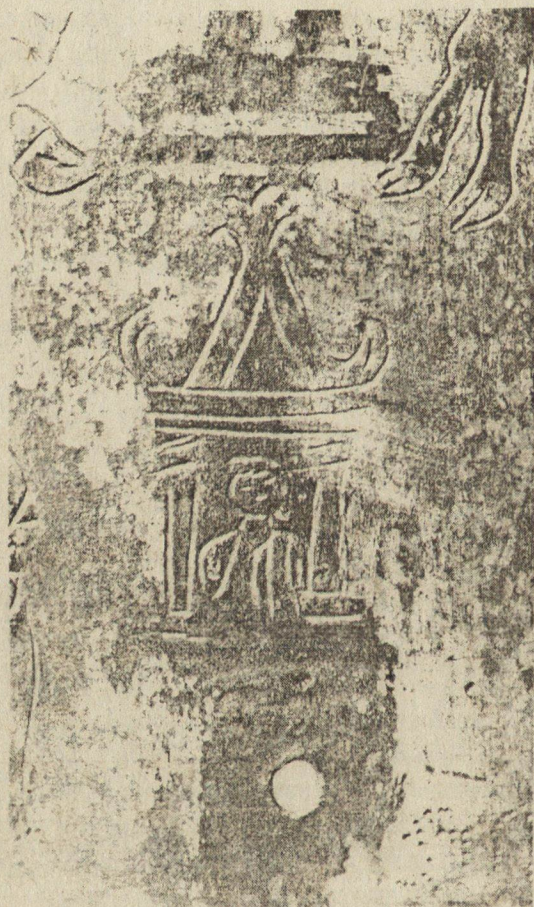
Обр. 1. Детайл от закрепването в средата на основата

Намерената отново плочка е изработена от бронз и е покрита с благородна зелена патина (обр. 1) 10 . Запазената ѝ височина е 26,9 см, ширина 24,8 см, дебелина 0,2 см. Гърбът ѝ е грубо полиран. Под върха е счупена и е твърде вероятно, както предполага Мерла 11 , това да е един белег, че тя, както и други подобни паметници, е завършвала с малка фигурка на Виктория. Внимателното изследване на плочката показва, че по краищата на наклонените страни минава една гладка ивица широка от 0,4 см до 0,5 см и вероятно това са следите от рамката, в която е била монтирана. В средата на основата е бил пробит отвор за закрепяне на плочката върху подпора. Това за-