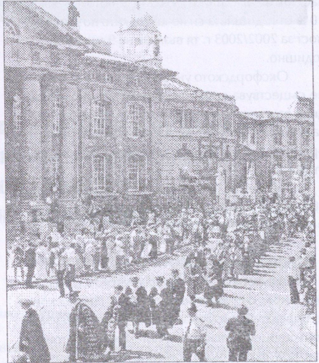
Поглед към Оксфордския университет

Дейността на издателството се контролира от университета, който назначава група делегати, избрани от академичния персонал. Делегатите заседават на всеки две седмици, като председател на заседанието е ректорът на Оксфордския университет. Те активно се включват в планирането и осъществяването на програмата на издателството. Преди да бъдат отпечатани, всички книги