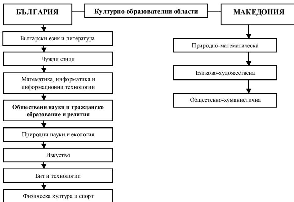
Фиг. 1. Културно-образователни области в България и Македония

В България основните културно-образователни области са осем, като всяка културно-образователна област осигурява взаимна връзка между отделните учебни предмети, а в Македония са три – фиг. 1.