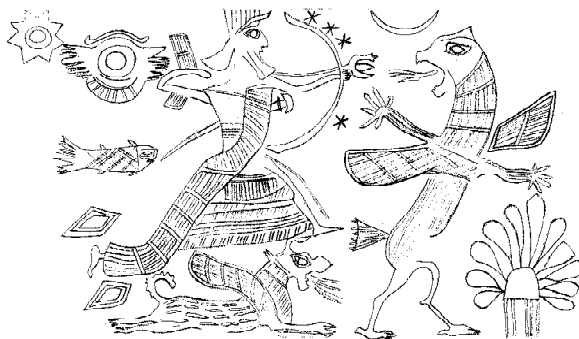
Образ 1. Цилиндров печат MS O689