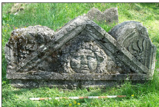
Обр. 2. Част от саркофаг с изображение на Горгона/Медуза от Nicopolis ad Istrum