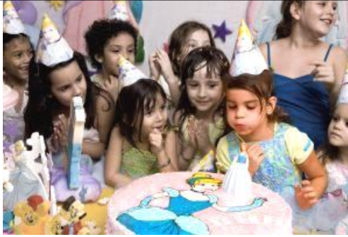
Обр. 3. Образ стимул по темата „Лични празници – Рожден ден” 3