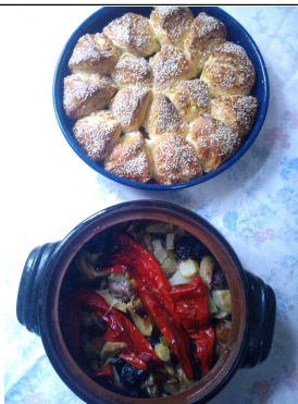
Обр. 7. Образ стимул по темата „Традиционен празник – Гергьовден, Празнична трапеза”, В1 7