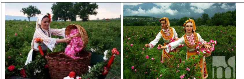
Обр. 5. Визуално-вербални образи стимули по темата „Традиционен празник – Празник на розата”, ниво А2 5

Празникът на розата е през първите почивни дни на юни. Този празник се празнува в гр. Карлово и гр. Казанлък. На площада в града се избира най-красивото момиче. Тя е царица на розата.