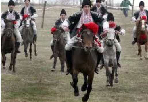
Обр. 6. Образ стимул по темата „Традиционен празник –Тодоровден, ниво А2” 6