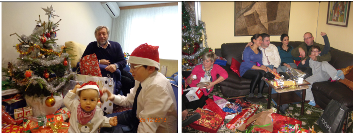
Обр. 1. Нова година 1