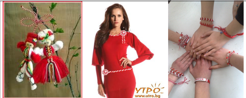
Обр. 4. Визуално-вербални образи стимули по темата „Традиционен празник – Баба Марта” 4