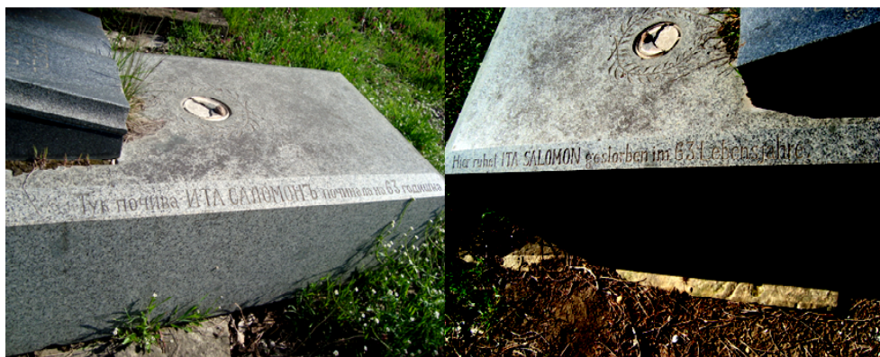
Фиг. 5. Двете страни на една надгробна еврейска плоча. Надписът от едната страна е на български език, от другата на немски, а този върху мраморната отворена книга е на иврит. Снимка – Мл. Василев, април, 2011 г.

Както се спомена, през XVI век трите еврейски общности се обединяват и вместо три отделни, съграждат един общ храм. Синагогата била с приблизителни размери 12/20 м., ориентирана с дългата си ос в посока север – юг 43 . До нея било разположено еврейското училище. Между синагогата и кервансарая, както и западно от нея, били наредени еврейските дюкяни.