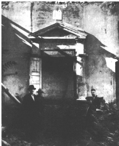
Последната синагога на Никопол, основана от Йосеф Каро през XVI в. (снимката е от ср. на XX в.)

Бързият темп на нарастване на еврейското население поражда необходимостта от построяването на нова синагога, чийто строеж завършва през 1559 г. Възщност писмените извори от началото на XVI в. споменават за синагога в Никопол, наричана Плевня. Името ѝ най-често се свързва с преселената от Плевен еврейска общност – въпрос, на който обръща внимание по-долу Младен Василев. Известно е, че към построената в средата на XVI в. нова синагога има училище и приют за бедни. Със сигурност се знае, че през 1570 г. в Никопол е имало поне две синагоги – едната е принадлежала на по-бедната, романьотска общност, другата – наречена „горна“, е била на заможните сефаради 32 . Ако се доверим на сведенията в изследването на Ст. Райчевски 33 , в края на века в Никопол вече има 4 синагоги (те са 4 и в Плевен).