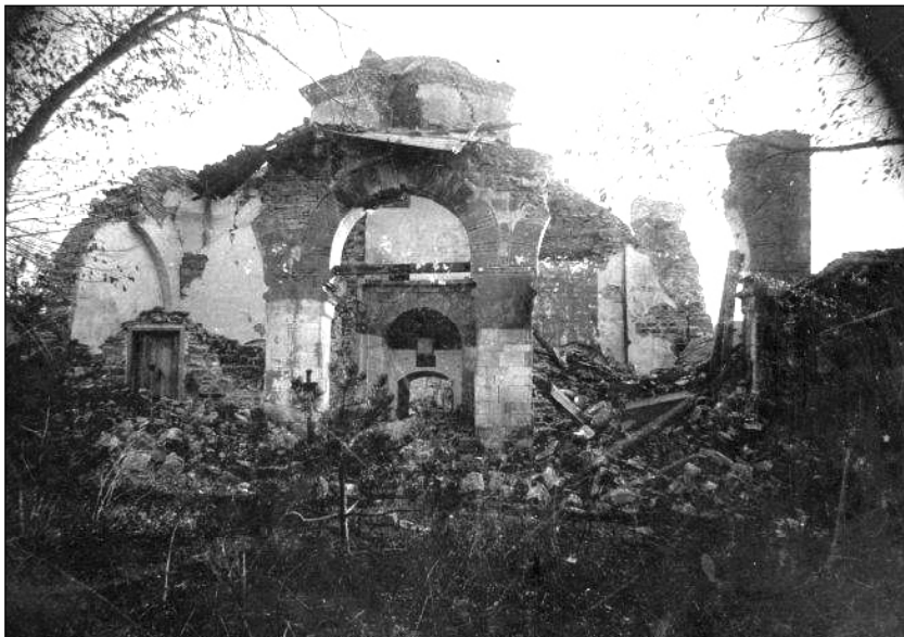
Обр. 2. Портикът на Фируз бей джамия след земетресението от 1913 г. – снимка