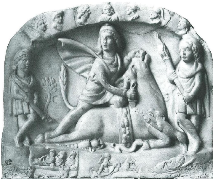
1. Релеф на Митра от Болоня (Museo Civico di Bologna)