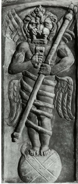
5. Леонтоцефален Кронос от Рим (Museo di Torlonia)