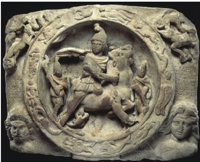
3. Релеф на Митра със зодиак от Лондон (The Museum of London)