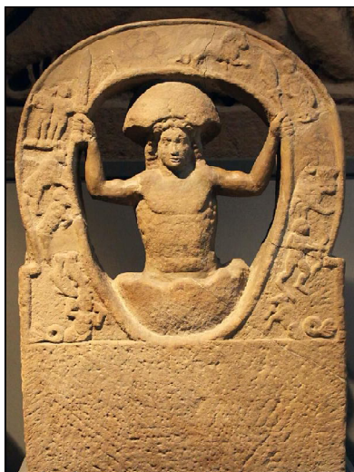
8. Митра със зодиак, раждащ се от Световното яйце (Newcastle, Museum of Antiquities)