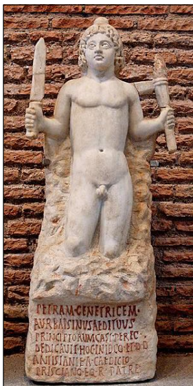
7. Статуя на Митра Petra Genetrix от Рим (Museo Nazionale Romano delle Terme di Diocleziano)