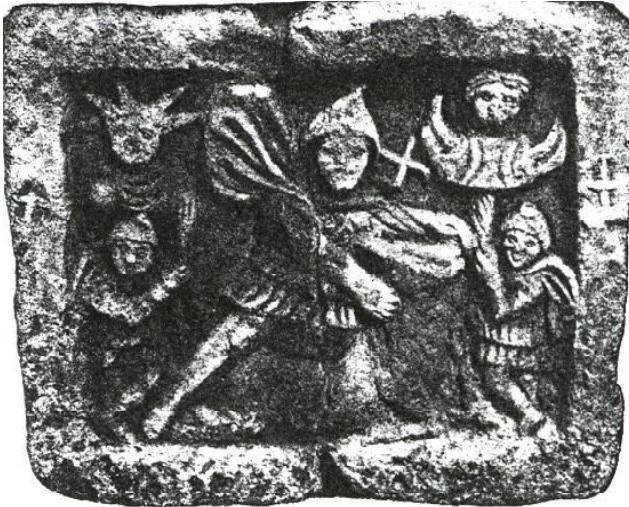
6. Релеф на Митра от Ескус (Национален археологически институт с Музей – София)