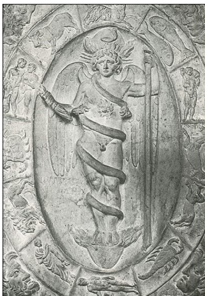
4. Релеф на Митра със зодиак от Модена (Museo di Modena)