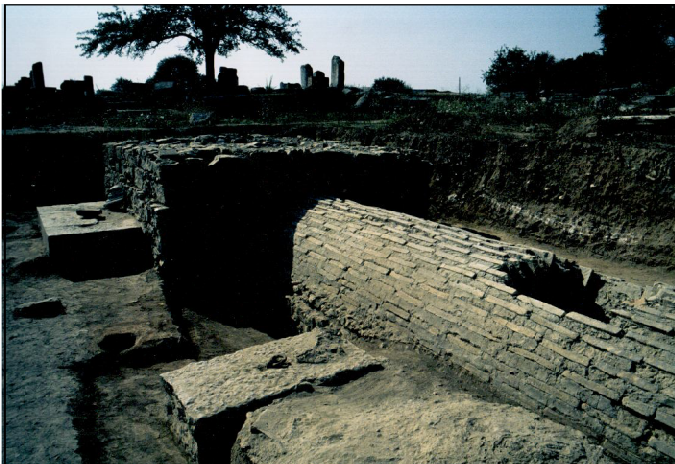
Обр. 3 Останки от култови съоръжения в централната част на форума и изграден върху тях постамент за конна статуя от IV в.