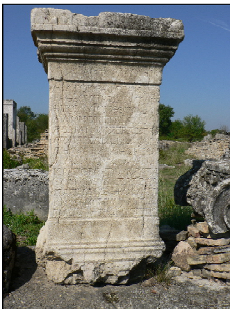
Обр. 1 Постамент за статуя на император Хадриан, 136 г.