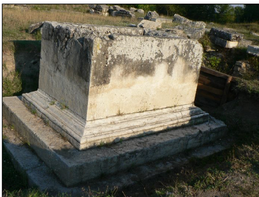
Обр. 2 Постамент за конна статуя на император Траян или император Хадриан, ранен II в.