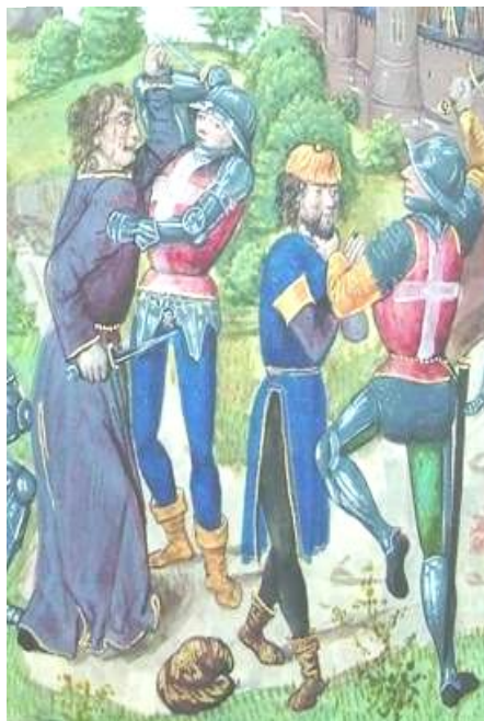
Окфорд, MS Douce 208, Commentaires de Cesar ,