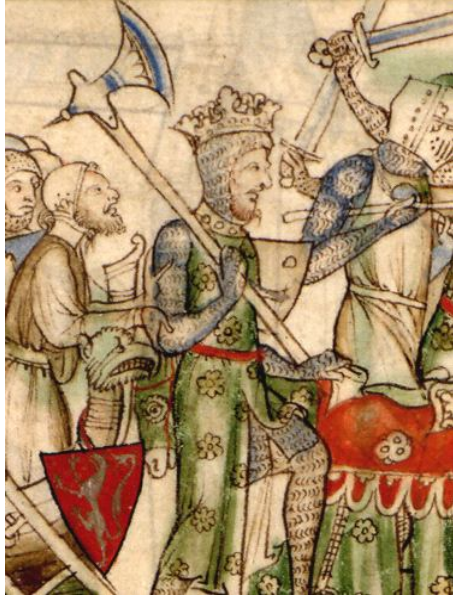
Кембридж, MS Ee.3.59, Fol. 31r.