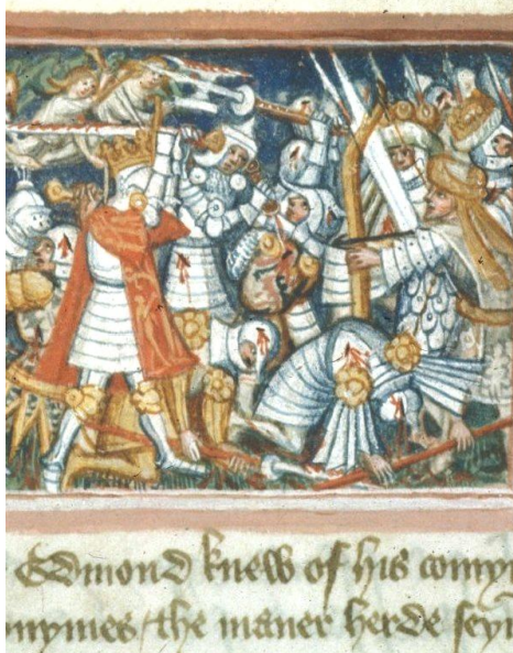
Британска библиотека, MS Harley 2278, Fol. 50 r.