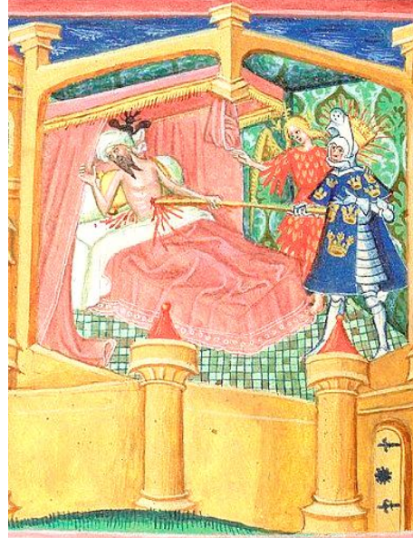
Британска библиотека, MS Harley 2278, Fol. 103v-104r.