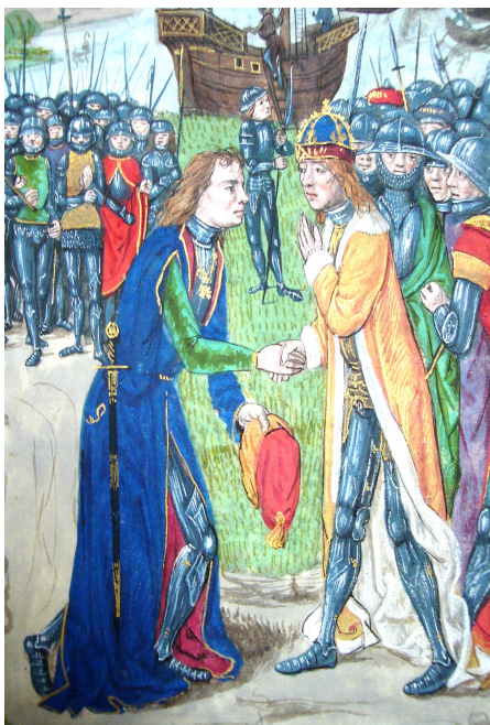
Окфорд, MS Douce 208, Commentaires de Cesar , Fol. Lxxiii.

37 MS Cotton Julius E IV, Fol. 7r, Fol. 8v.