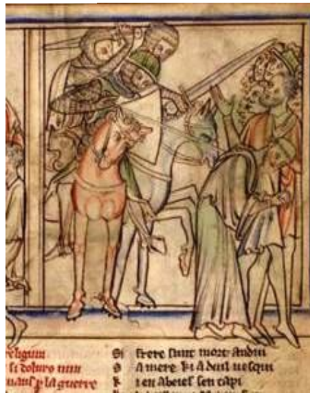
Кембридж, MS Ee.3.59, Fol. 6r.