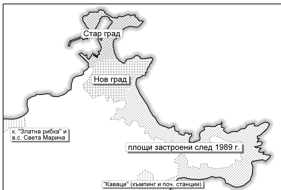
Фиг. 2. Териториално разрастване на гр. Созопол

Бизнесът се движи от стихията на собствената си ненаситност и след като не беше поставен в релсите на държавна концепция за развитие на туризма, не заложи на нищо друго, освен на масов туризъм в най-примитивен вид. Време е да се спре с пропиляването на ресурсите на 378-те километра български морски бряг. Очевидно е, че просто не разполагаме с ресурси за да бъдем конкурент на южните ни съседи в стандартен евтин ваканционен туризъм. Гърция и Турция, имат над 20 хил. км морски брегове, и то по-топли от нашите. Шанс дават единствено възможностите за развитие на висококачествени и скъпи туристически услуги. Идеите за балансирано развитие не означават край на растежа, но твърде бавно проникват в съзнанието на отговорните в туристическия бранш и общинската администрация.