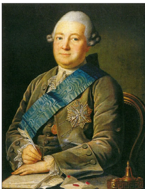
Хелиографюра върху хартия на Адам В. Олсуфиев от неизвестен автор (колекция на Рибински държавно-исторически и архитектурно-художествен музей резерват, гр. Рибинск, Ярославска област, Русия) по портрет от 1773 г. върху платно, маслени бои от Carl-Ludwig Johann Christinesk (Карл-Людвиг Йохан Христинек), от Областната картина галерия в гр. Твер, Московска област, Русия.

В предисловието си към първия том Д. А. Ровински отбелязва: „Материалите за всеки от набелязаните от мен раздели се насъбраха предостатъчно, но в ред от тях има все още значителни пропуски, за чието попълване до издаването на систематическия указател за иконографията времето няма да е достатъчно. Най-досадното е това, че за издаването на почти готов раздел недостигат няколко листа с отпечатъци, които трябва да търся из частни колекции, а и зад граница. През това времето лети, редките и ценните отпечатъци, подготвени за изданието и пред-