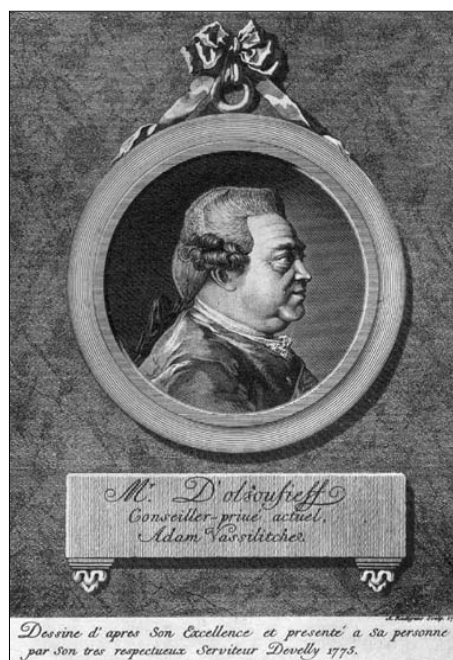
Портрет на Адам В. Олсуфиев. Гравюра от Антуан Радиг, 1775 г.