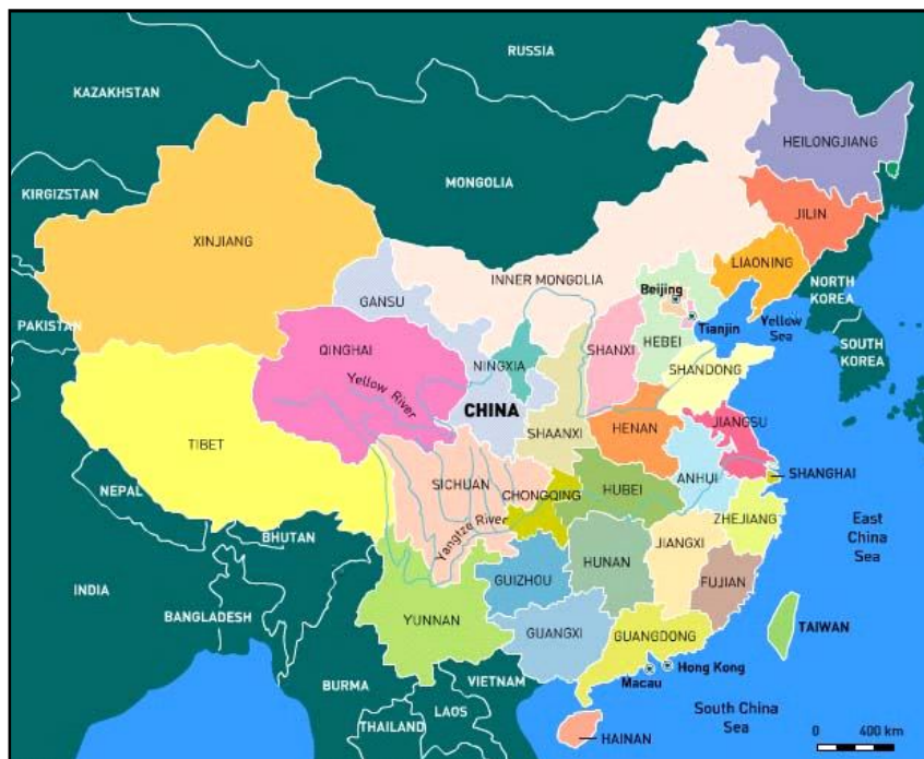
Обр. 1 – съвременна карта на провинциите в Китай