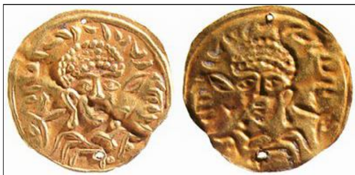
Обр. 3 – златен брактеат (имитация на византийски солид), открит в гроб на Шъ Суойен (Shi Suoyan), близо до гр. Гуюен (Guyuan)