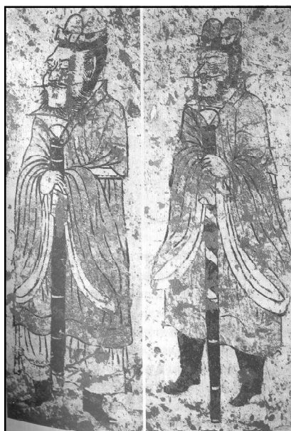
Обр. 2 – Шъ Шъу