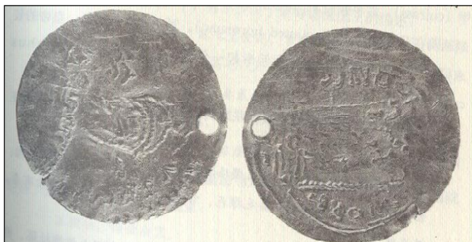
Обр. 5 – фалшив солид от гроба на Шъ Даодъ (Shi Daode)