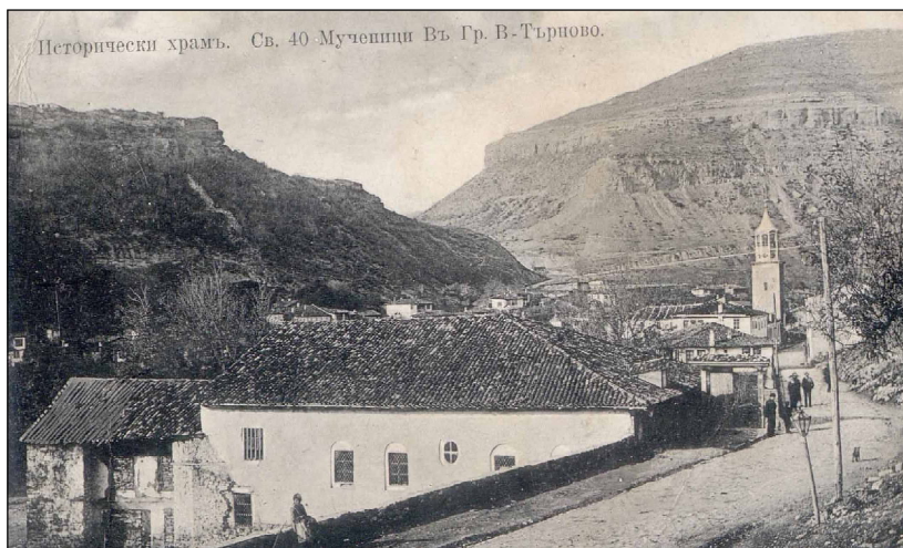
Образ 3. Напречна крепостна стена от изток