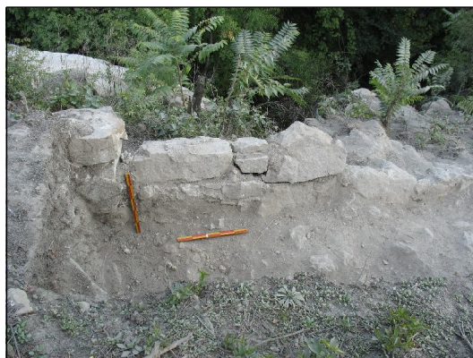
Образ 2. Фуга на Източната крепостна стена