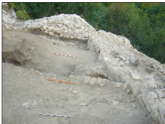
Образ 1. Фуга на Западната крепостна стена