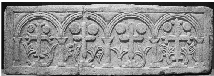
Образ 3. Стена на псевдосаркофаг от средновизантийския период. Византийски музей в Солун