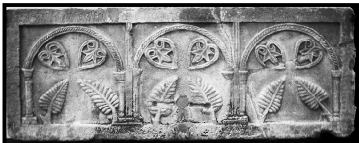
Образ 4. Стена на псевдосаркофаг от средновизантийския период. Национален археологически музей, София