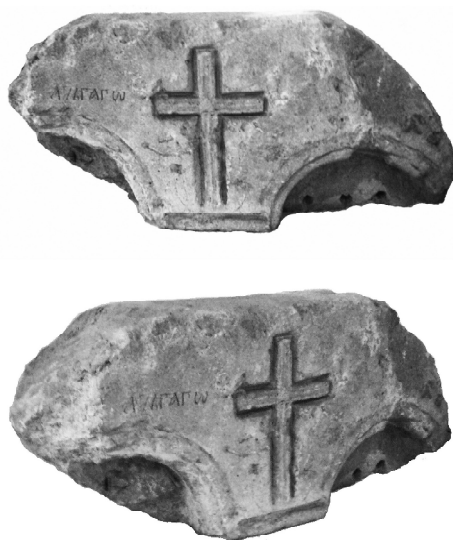
Образ 1. Част от епистил, открит на Царевец във В. Търново

За съжаление, от България са малко публикуваните фрагменти от иконостасни прегради от времето на Второто българско царство. Сред сравнително по-цялостно достигналите до нас паметници от Търново се откроява разглежданата част от епистил, открит на Царевец. Семплата украса, материалът (варовик) и палеографията на надписа върху него свидетелстват, че в разглеждания случай става въпрос за епистил на протезис от темплона на трикорабна куполна църква, чиято датировка най-вероятно трябва да се търси в рамките на XIV в. Изглежда това е един от последните примери в столично Търново за употреба на каменни релефи, преди дървото да замести камъка (мрамора) като материал за направа на иконостаса.