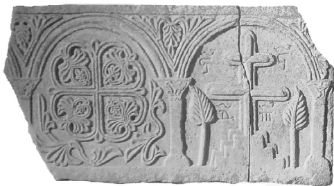
Образ 5. Стена на псевдосаркофаг от манастира Пантократор на Атон, XIV в.