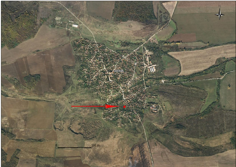
Обр. 6. Ортофото изображение на с. Върбовка, с мястото където е открито Fig. 6. Orthoimage of the village of Varbovka showing where the car was localised.