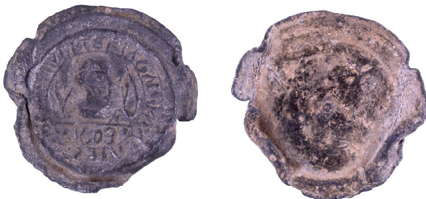
Обр. 2. Капаче за териак от местността „Кая бунар”, с. Хотница, Великотърновско. Fig. 2. A cap for theriac from the Kaya Bunar area, the village of Hotnitsa, Veliko Tarnovo region.