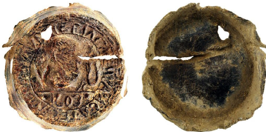
Обр. 1. Капаче за териак от с. Върбовка, Великотърновско. Fig. 1. A cap for theriac from the village of Varbovka, Veliko Tarnovo region.

Dursteler, E. R. 2013 – Eric R. Dursteler. A Companion to Venetian History, 1400–1797. Leiden, 2013.