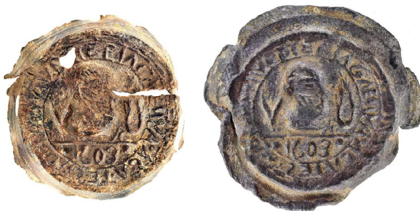
Обр. 3. Фотограмметрично заснемане на двете капачета. Fig. 3. A photogrammetric image of the two caps.