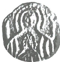
Обр. 3. Иван Шишман (1371–1393). Сребро.