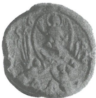
Обр. 5. Моливдовул на патриарх Симеон (?–1348).

2001 :130). Директно изследване, и то продължително време, осъществих при лична работа с печата. Изводът ми е, че печатът е оригинален. Доводите и аргументите докладвах на миналия, Осмия симпозиум на Търновската книжовна школа, поради което повече няма да се спирам на темата автентичност (Харитонов, 2004).