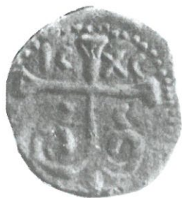
Обр. 1. Иван Александър (1331–1371). Мед.

на владетелската власт се представят, но не всички, при което и да е изображение поотделно.