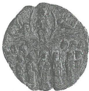
Обр. 4. Моливдовул на патриарх Висарион (? – Първа четв. на XIII век).