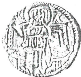
Обр. 7. Михаил III Шишман (1323—1330). Сребро.