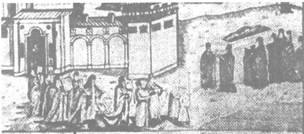
Ил. 1. а) Щампа „Св. Йоан Рилски с житие“, 1792, гравирана в Москва от дякон Николай; б) детайл от щампата с „Посрещане на мощите“.