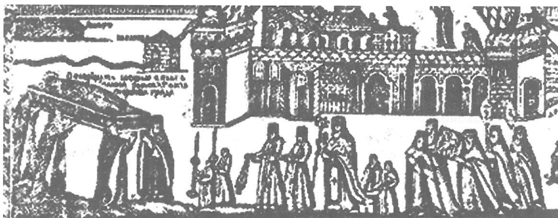
Ил. 2. а) Щампа „Св. Йоан Рилски с житие“, 1809, гравирана в Москва от йеромонах Гавриил; б) детайл от щампата с „Посрещане на мощите“.