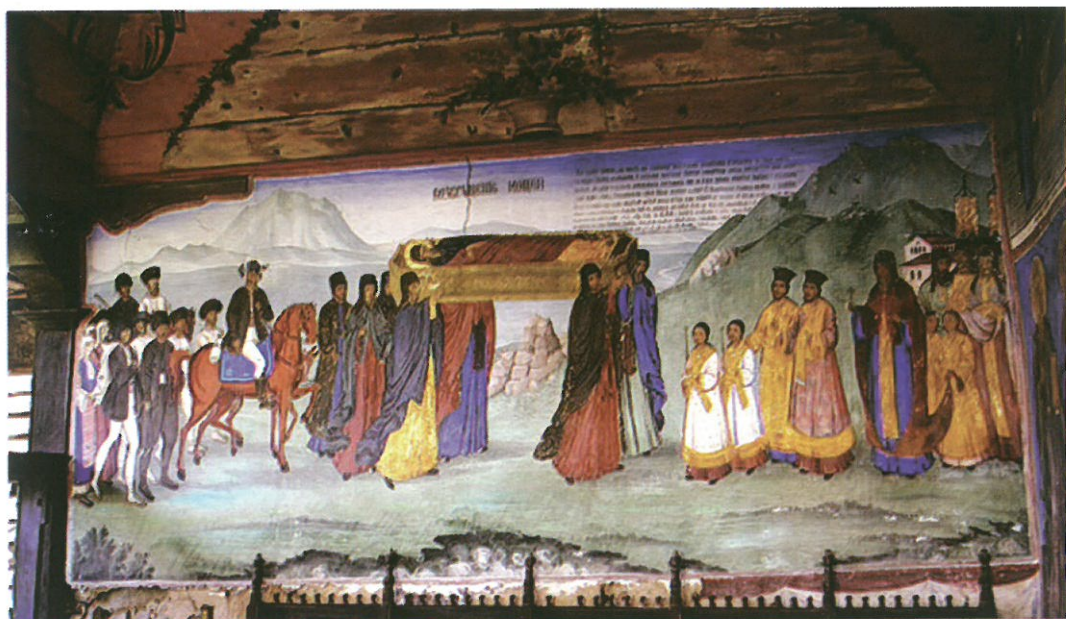
Ил. 7. Стенопис в метоха Орлица при Рилския манастир от Никола Образописов, 1863.