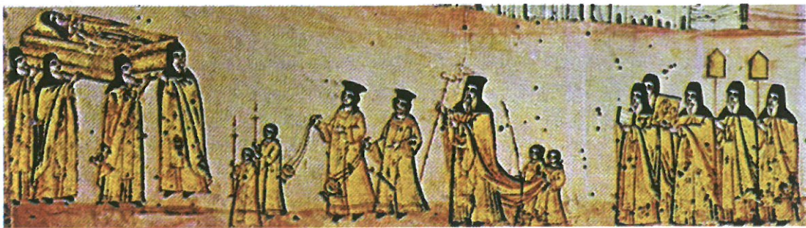
Ил. 3. Детайл от икона на тревненския зограф Цоню Симеонов, 1821.