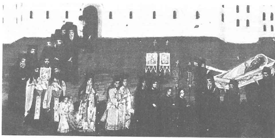
Ил. 6. Част от икона „Св. Йоан Рилски с житие“ от самоковския зограф Йоан Иконописец, средата на XIX в. (преди 1857)

А не трябва да се забравя още нещо: макар пренасянето на мощите на св. Йоан Рилски от Търново в Рилския манастир да се чества от братството на ежегоден празник със служба (на 1 юли), тя и днес се извършва в храма според последованието на всяка друга служба на светителски празник. Сиреч — конкретният исторически епизод се припомня литургично, но не се възпроизвежда символично, чрез действие — и това е една от принципните разлики между него (и изображенията му) и легендарните епизоди, свързани с появата или деянията на някои чудотворни манастирски икони (Богородичните икони на Бачковската или Троянската