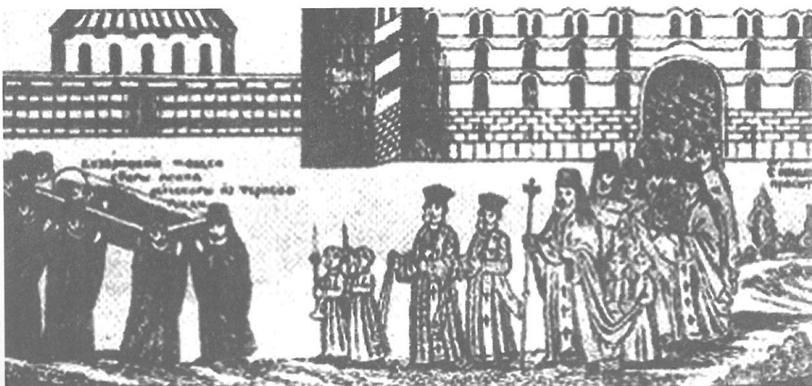
Ил. 5. а) Шампа, гравирана от Томас Сидер през 1839 г.; б) детайл от шампата с „Посрещане на мощите“.