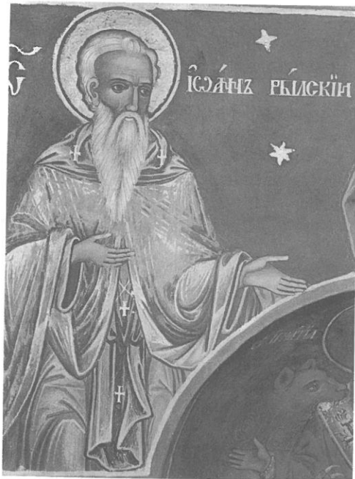
Фото 9. Св. Йоан Рилски, параклисът на постницата „Св. Лука“, 1799 г.