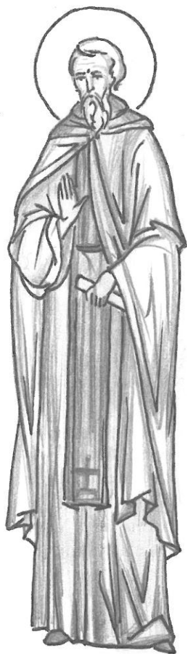
Рис. 1. Примерна рисунка на иконографски подтип 1 като преподобен