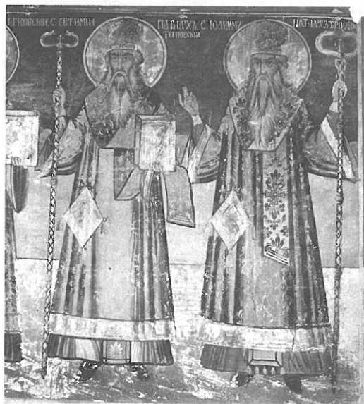
Фото 3. Св. Йоаким патриарх Търновски и св. Евтимий патриарх Търновски. Араповски манастир, 1864 г.