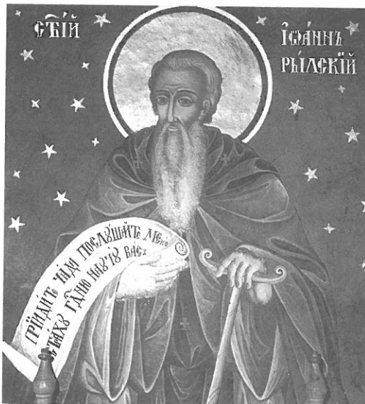
Фото 10. Св. Йоан Рилски, параклис „Св. Йоан Богослов“, 1921 г.