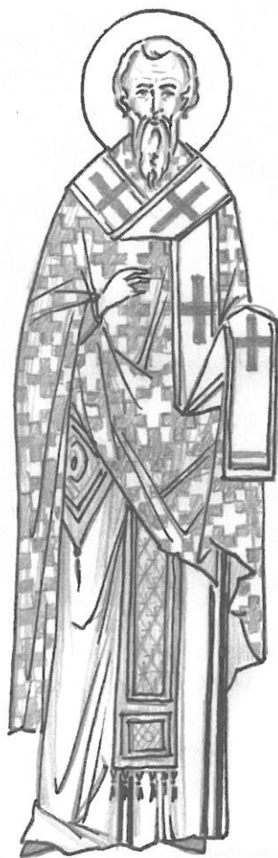
Рис. 2. Примерна рисунка на иконографски подтип 2 като архиеп