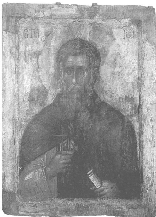
Фото 6. Св. Йоан Рилски, икона от музея на Рилския манастир, XIV в.