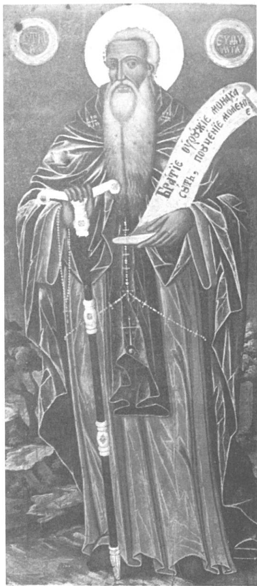
Фото 2. Св. Евтимий, патриарх Търновски. Икона от църквата „Св. Георги“ от с. Хаджидимово