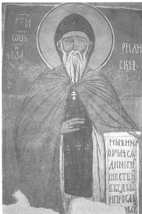
Фото 7. Св. Йоан Рилски, Земенски манастир, църквата „Св. Йоан Богослов“, XIV в.