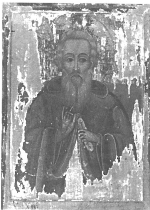
Фото 1. Св. Евтимий патриарх Търновски – едната страна на дву- странната лицева икона от музея в гр. Ловеч