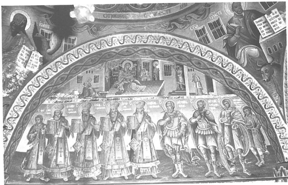
Фото 4. Български патриарси. Капиновски манастир, XIX в.