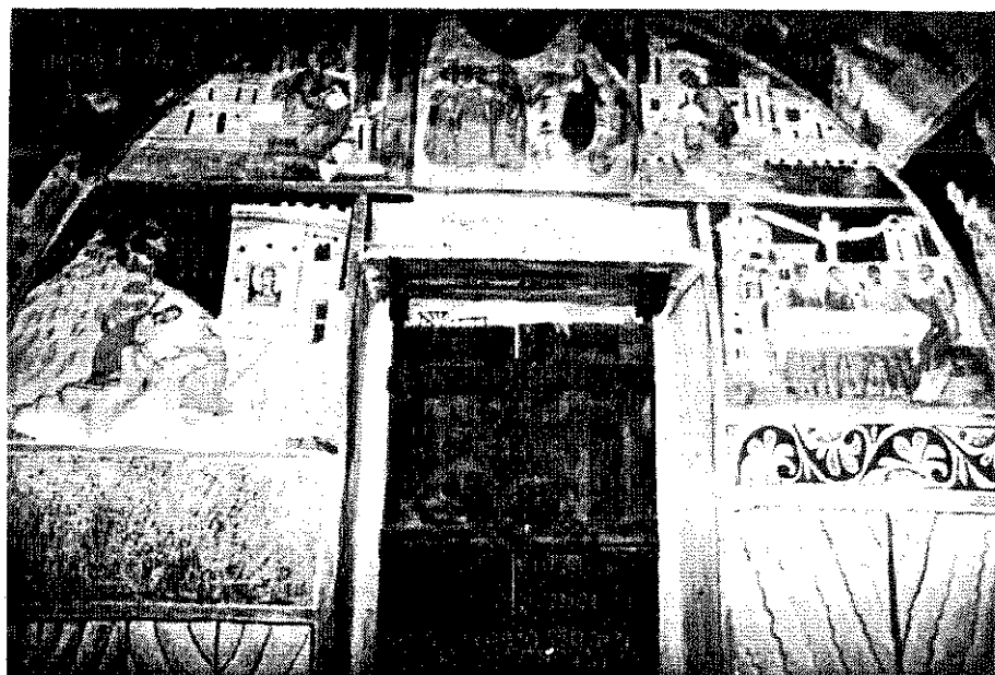
Обр. 2. Западната стена на параклиса „Св. Йоан Кръстител“ в църква „Рождество Христово“ в с. Арбанаси

На западната стена цикълът е прекъснат от фигурите на евангелистите Лука и Марко. Между тях, точно над вратата, е показана сцената „Проповедта на Йоан в пустинята“ (Обр. 2). Върху свитъка, който светецът държи, четем текста по Матей (3:2) „Покайте се пред идващото цар-