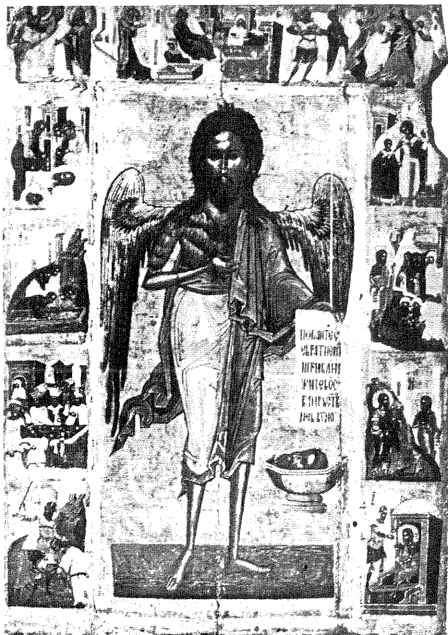
Обр. 4. Икона от Историческия музей в Москва, 1593 г.

фреските в манастира продром в Серес и на българската житийна икона на Кръстителя, съхранявана в Московския исторически музей от 1593 г., като при последната жените, държащи деца, са две. (Обр. 4).