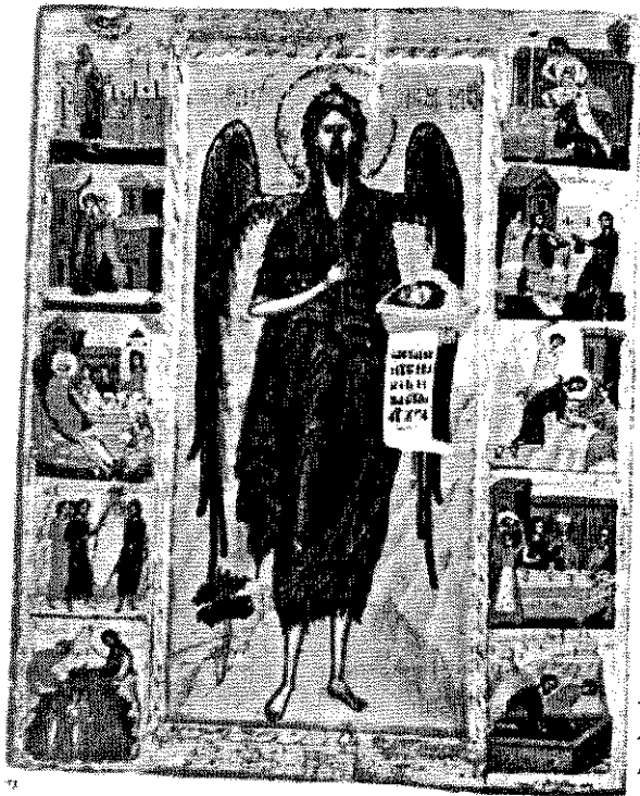
Обр. 5. Икона от параклиса на църква „Рождество Христово“ в с. Арбанаси. Първата половина на XVII в.

На иконостаса в същия параклис е запазена житийна икона на Кръстителя, която е синхронна по изработка — от първата половина на XVII в. 21 Творбата съдържа 10 житийни епизода, повечето от които повтарят тези от стенописната украса на параклиса (Обр. 5). Те са разположени в два