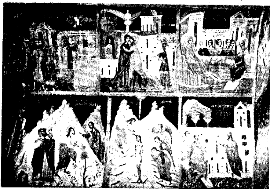
Обр. 1. Южната стена на параклиса „Св. Йоан Кръстител“ в църква „Рождество Христово“ в с. Арбанаси

Житийният цикъл на светеца в Арбанаси е познат от 2 икони от XVII и XVIII в. и стенописната украса в наоса на параклиса „Св. Йоан Предтеча“ от 1632 г. на църквата „Рождество Христово“. При последния става дума за един от най-ярко и пълно представените цикли от неговото житие сред паметниците на късносредновековното изкуство у нас. В него са включени 15 епизода, като някъде са обединени две, или повече събития. Сцените са разположени на южната, западната и северната стени на наоса. Подредени са в два пояса, като от юг и север всеки пояс съдържа по три сцени, а на западната стена са показани общо 3 епизода. Последните са разположени отляво и отдясно и един над вратата на наоса. Епизодите са подредени в сравнително точен хронологически ред, като започват от южната стена с „Благовещението на Захарий“, „Срещата на Мария и Елисавета“ и „Рождеството на Йоан Кръстител“, които са особено подробно разработени. (Обр. 1). При „Благовещението на Захарий“, например, ангелът съобщава добрата новина пред група евреи, до-