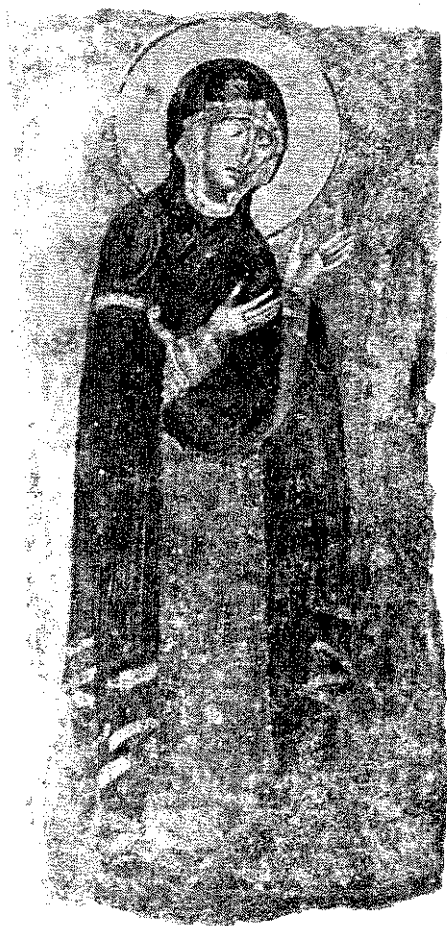
обр. 3 Св. Богородица от сцената „Деусис“. Стенописен фрагмент от средновековната църква „Св. Никола“ в гр. Мелник, XII–XIII век.