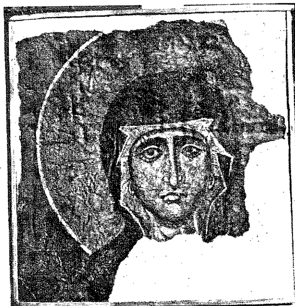
обр. 10 Главата на св. Богородица (детайл от сцената „Възнесение Христово“). Стенописен фрагмент от средновековната църква „Св. Никола“ в гр. Мелник, XII–XIII век.