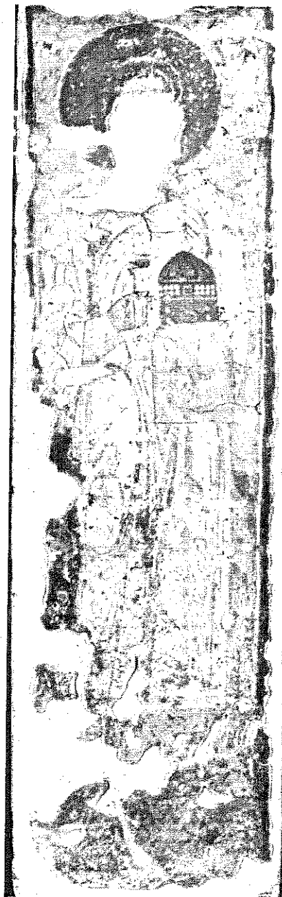
обр. 2 Фигура на дякон. Стено- писен фрагмент от средновековната църква „Св. Никола“ в гр. Мелник, XII–XIII век.