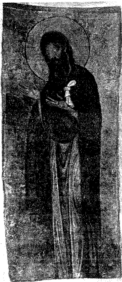
обр. 4 Св. Йоан Кръстител от сцената „Деусис“. Стенописен фрагмент от средновековната църква „Св. Никола“ в гр. Мелник, XII–XIII век.

6. Св. Богородица Ширшяя небес от конхата на апсидата на протезиса.