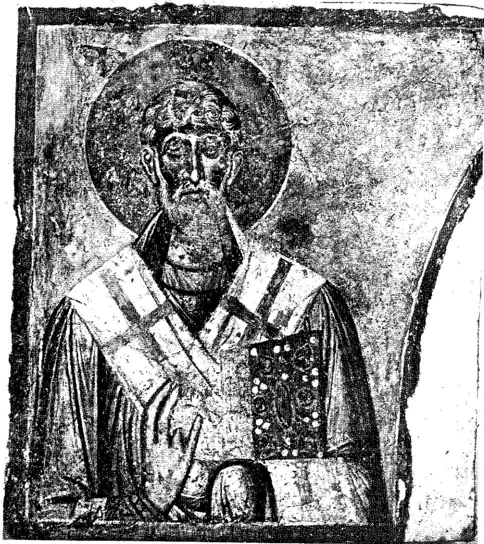
обр. 5 Апостол. Стенописен фрагмент от средновековната църква „Св. Никола“ в гр. Мелник, XII–XIII век.