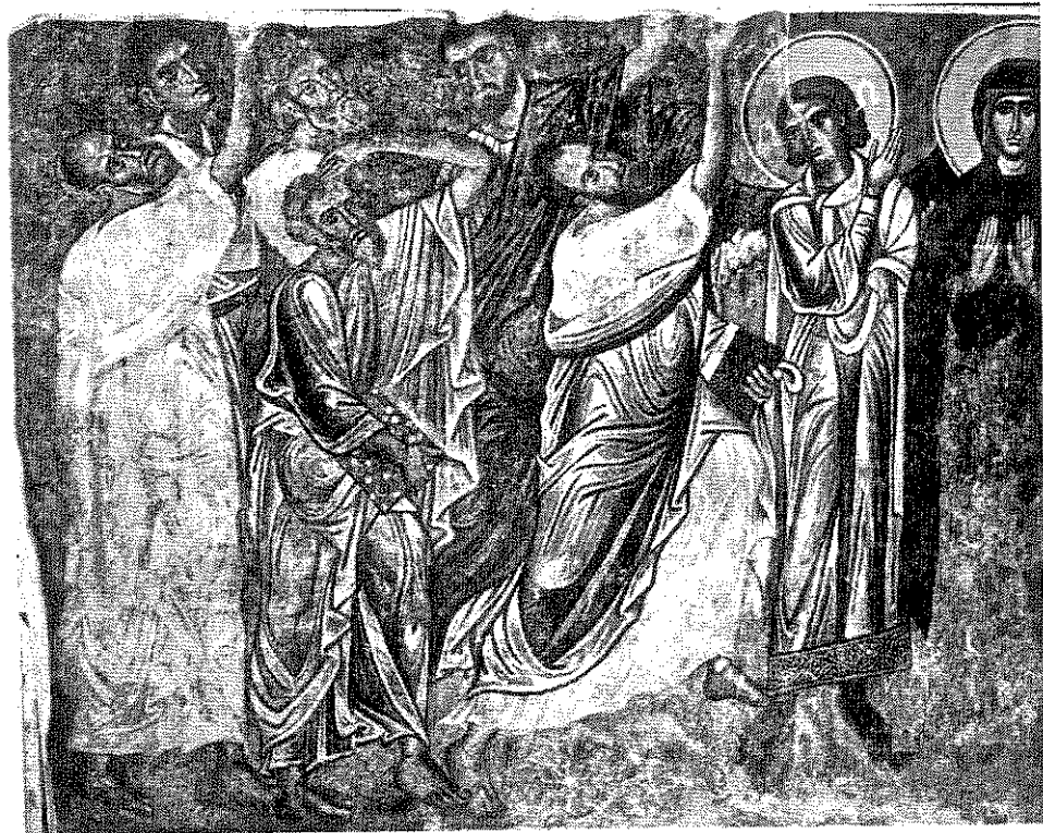
обр. 9 „Възнесение Христово“ (детайл). Стенописен фрагмент от средновековната църква „Св. Никола“ в гр. Мелник, XII–XIII век.