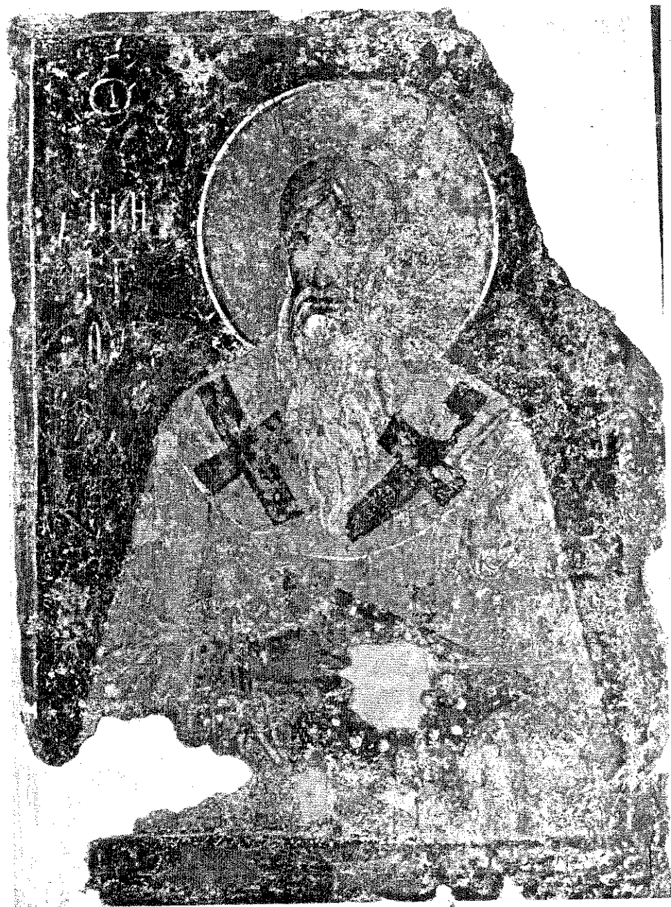
обр. 6 Неизвестен архиерей. Стенописен фрагмент от средновековната църква „Св. Никола“ в гр. Мелник, XII–XIII век.