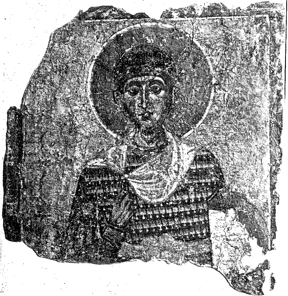
обр. 7 Свещец-воиш. Стенописен фрагмент от средновековната църква „Св. Никола“ в гр. Мелник, XII–XIII век.

приолтарния стълб от дясно на централната апсида. Най-вероятно — Св. Димитър. обр. 7