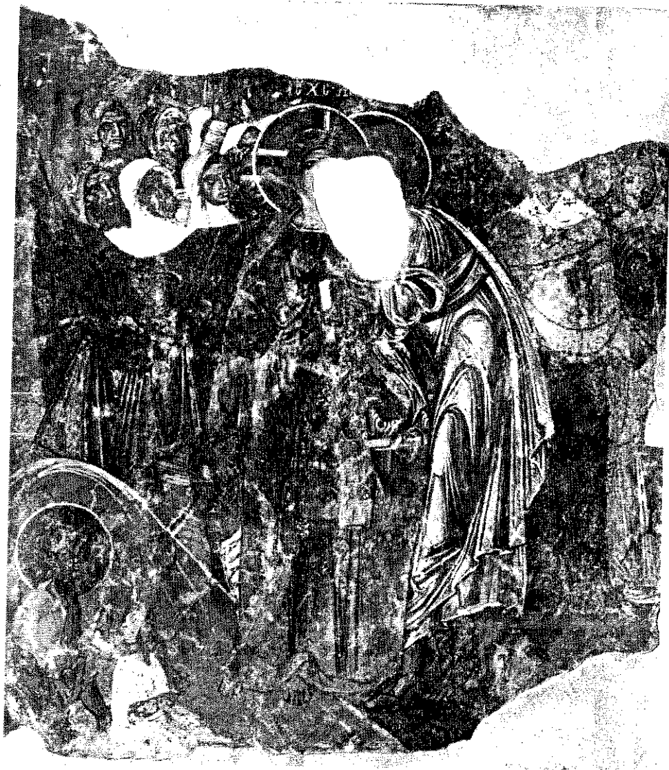
обр. 11 „Целувката на Юда“. Стенописен фрагмент от средновековната църква „Св. Никола“ в гр. Мелик, XII–XIII век.