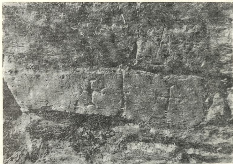
Обр. 3. Кръстове, вдълбани в лицето на крепостната стена при източния вход на крепостта

Четвъртата разкрита сграда на тази тераса представлява еднокорабна църква с един притвор. Запазената част от зидовете на църквата