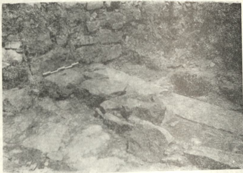
Обр. 2. Източният план на крепостта

Манастирът на Теодосий Търновски е бил разположен вътре в крепостта върху три естествени тераси, които следват наклона на билото