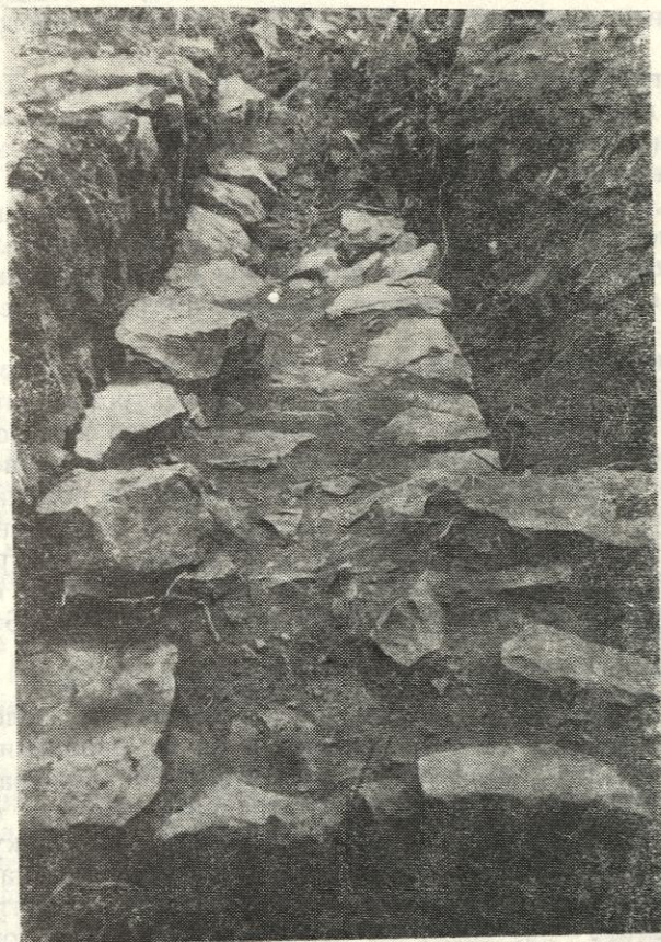
Обр. 5. Манастирска сграда край западната крепостна стена

Стратиграфските наблюдения и откритите материали показват, че още през ранновизантийската епоха — VI в., тук е била изградена крепост, която охранявала важния път, който води от Дунав през Хаинбоазкия проход за днешна Южна България. Тя се включва в системата