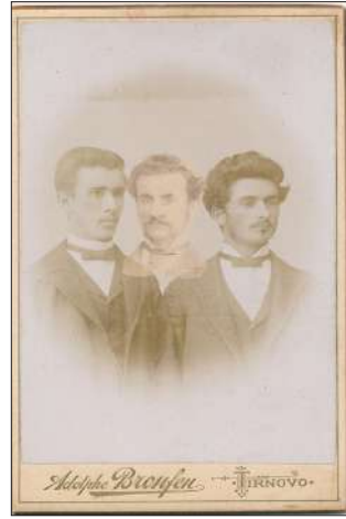
Ил. 6. Дигитална съпоставка (наслагване) на лицата от снимката – оригинал, съхранявана в НБКМ – БИА и снимката съхранявана в РИМ – В. Търново (Наслагване – Симеон Антонов)