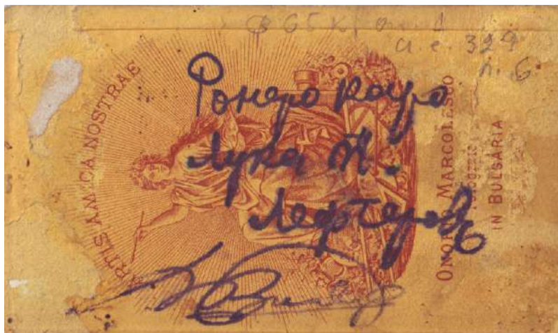
Илюстрация 1а. Гръб на снимката