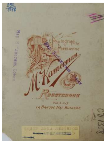
Илюстрация 4а. Грѐб на снимката