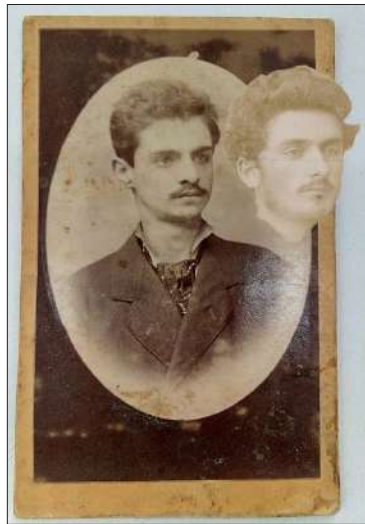
Илюстрация 7. Дигитална съпоставка (наслагване) на лицата от снимката, съхранявана в ДА – В. Търново и снимката съхранявана в РИМ – В. Търново (Наслагване – Симеон Антонов)