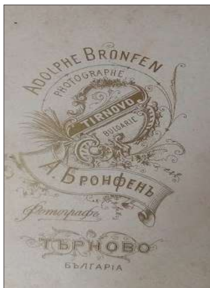
Илюстрация 2а. Гръб на снимката