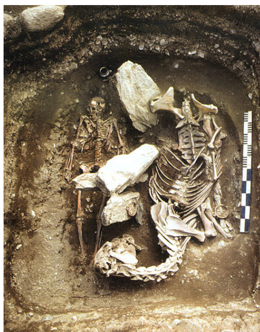
Обр. 4. Паралел на конското погребение от Централна Азия