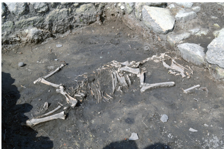
Обр. 3. Погребението на коня