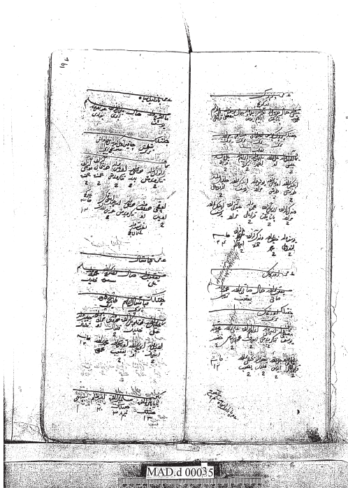
Обр. 6. Документът от 1464 г. и л. 196б на документ BOA, MAD 35