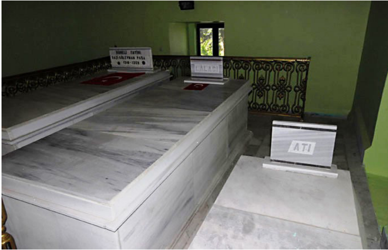
Обр. 5. Тюрбето на Сюлейман в Булаир