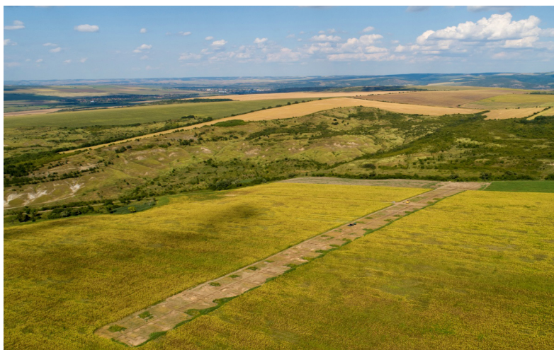
Обр. 1. Местоположение на обекта. Аерофотография след приключване на разкопките (автор Георги Христов)